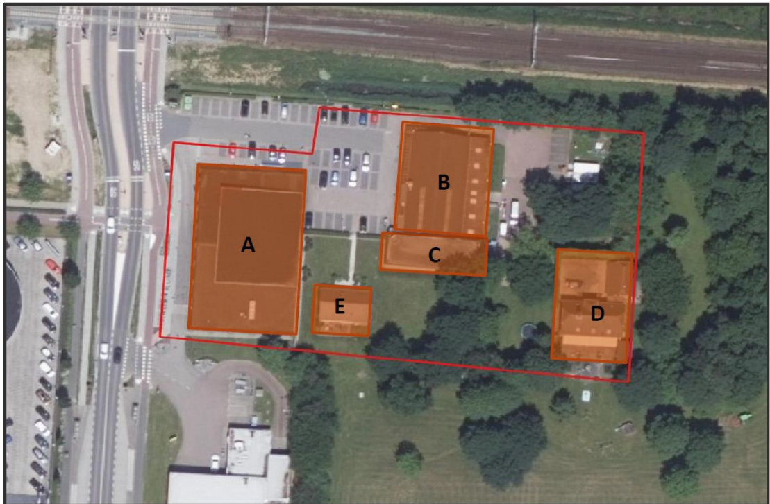
Figuur 2. Begrenzing projectgebied Rijksstraatweg 72 te Meteren (rode lijn) en een overzicht van de te slopen bebouwing (A= Aldi supermarkt; B=Fietsenwinkel; C=Slijterij; D= Bewoond huis; E= Onbewoond huis).