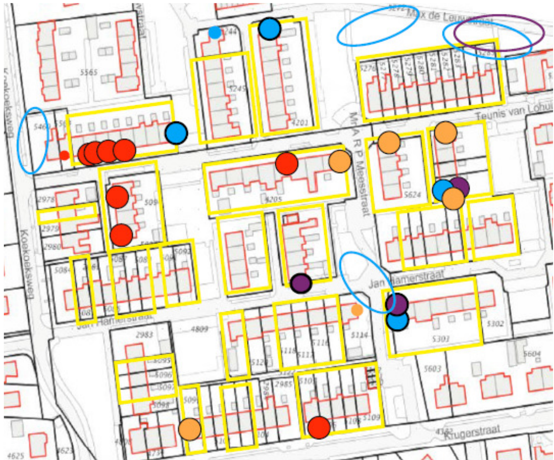
Figuur 3 Aangetroffen voortplantings- en rustplaatsen van de huismuis (rood), gierzwaluw (oranje), gewone dwergvleermuis (blauw) en laatvlieger (paars). De woning aan de Jan Hamerstraat 39 is geen onderdeel meer van het plangebied.