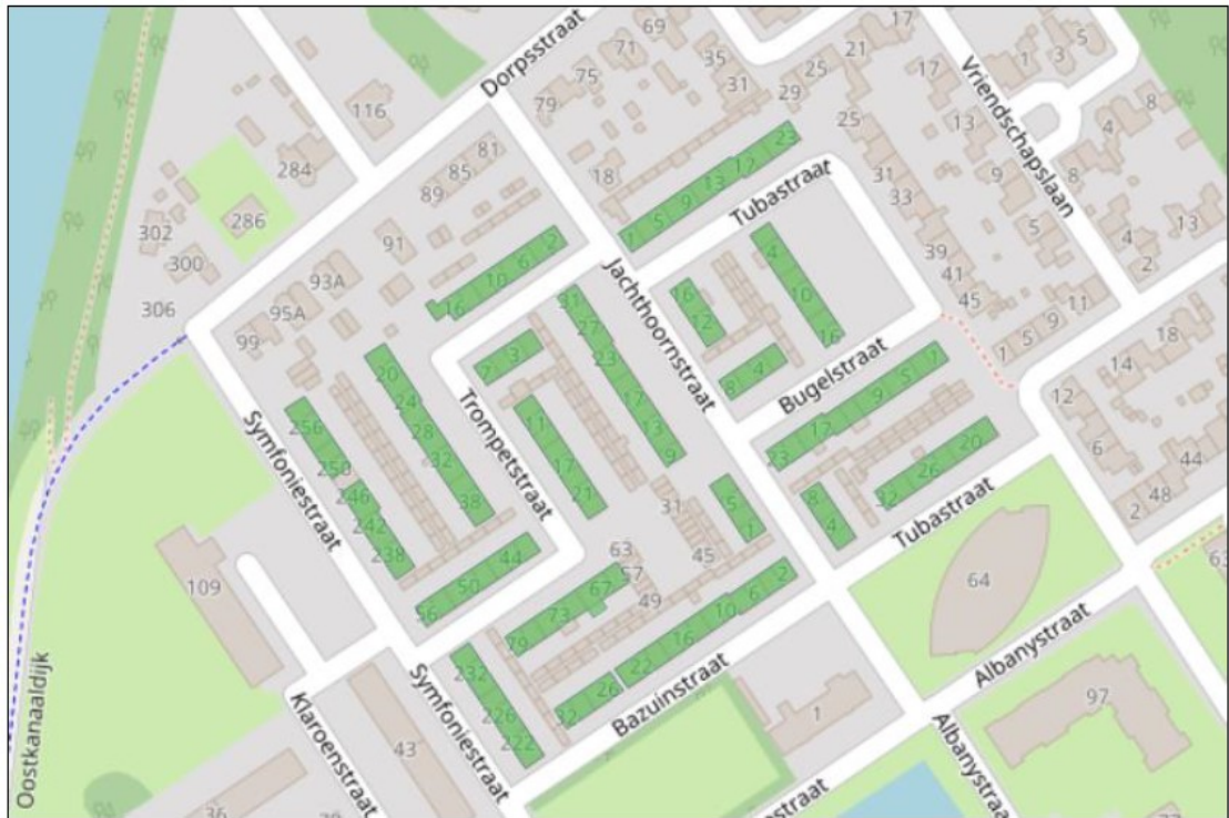
Figuur 1: Plangebied Neerbosch-Oost