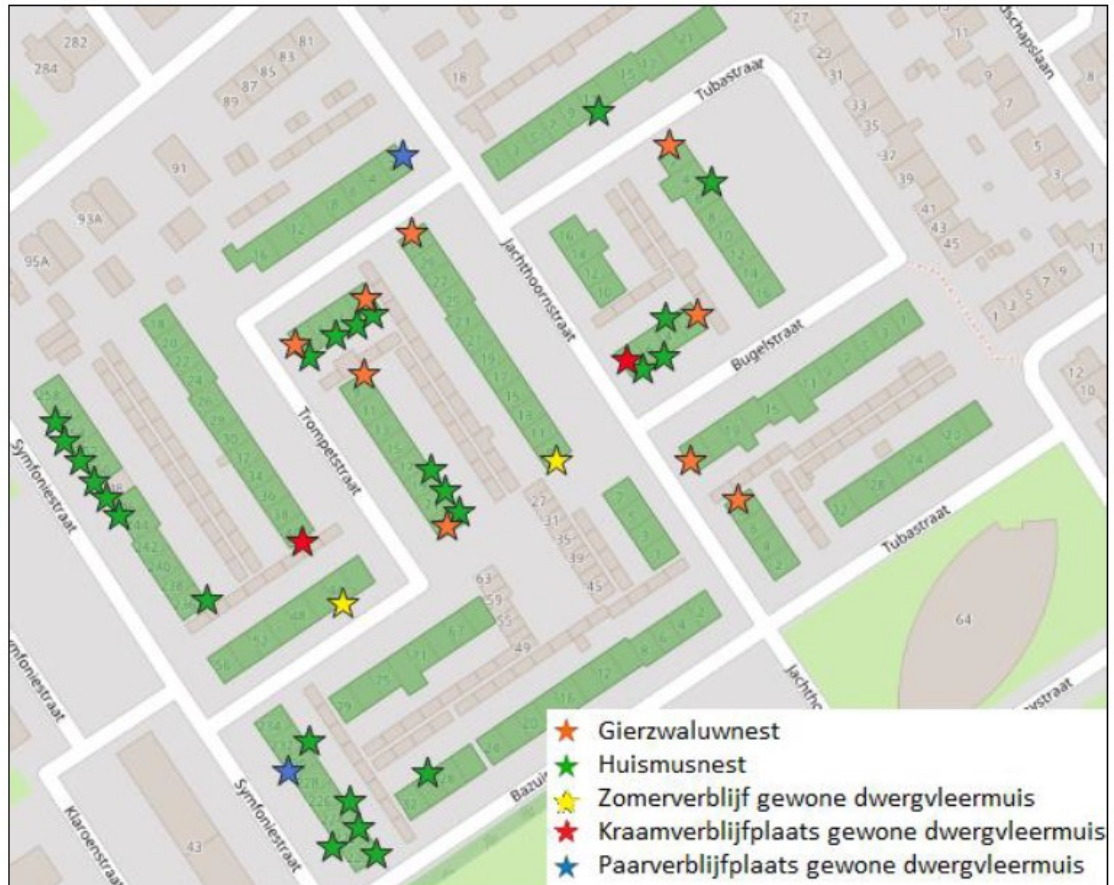
Figuur 2: Aangetroffen ecologische functies op kaart