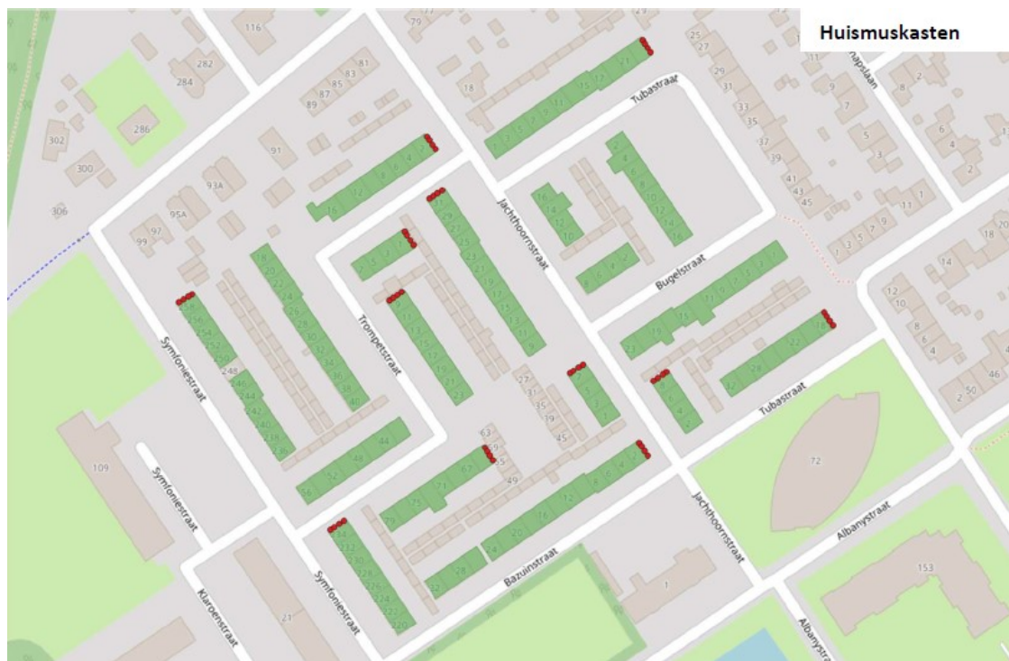
Figuur 3: Tijdelijke mitigatie huisruis