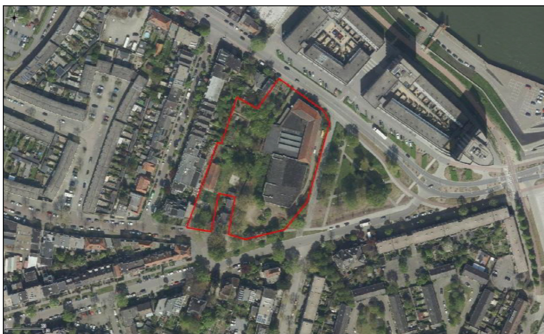
Figuur 2. Begrenzing plangebied Krayenhofflaan te Nijmegen.