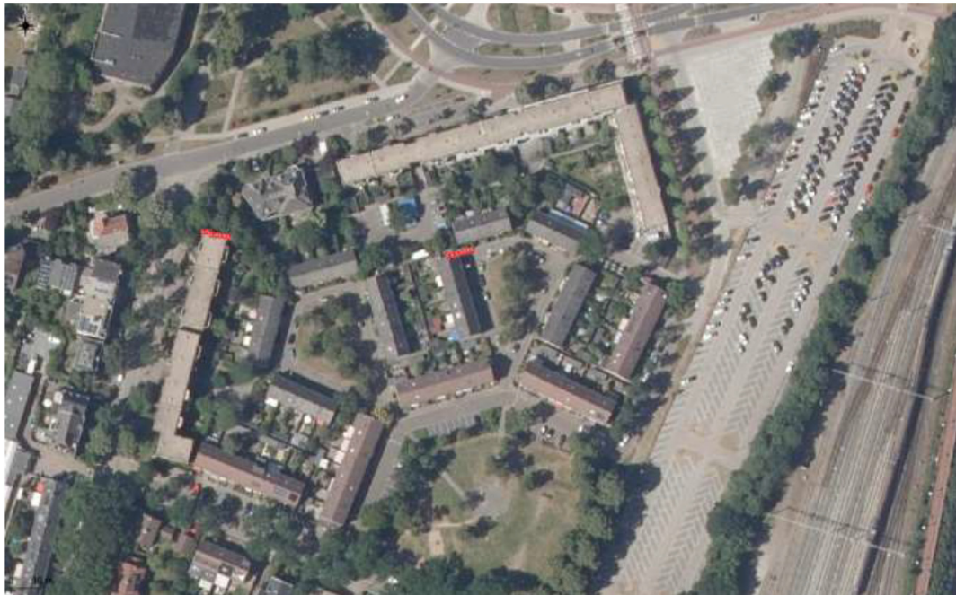
Figuur 5. Locaties tijdelijke voorzieningen huismuis aan de Krayhofflaan 9 en Uiverplaats 6 (rood) in de woonwijk ten zuidoosten van het plangebied.