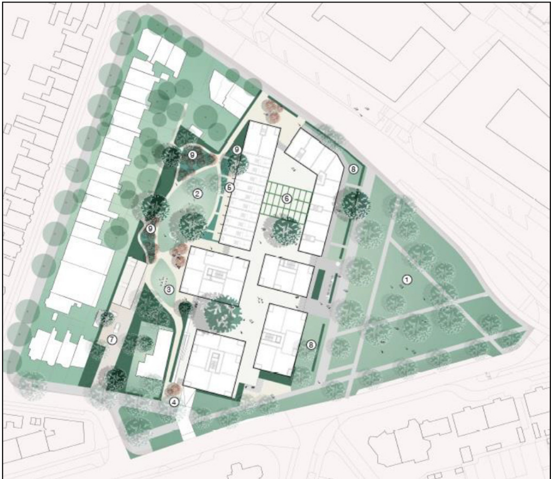
Figuur 3. Nieuwe situatie (concept) plangebied Krayenhofflaan te Nijmegen.