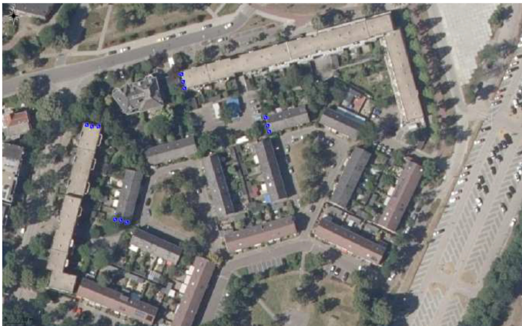
Figuur 6. Locaties tijdelijke voorzieningen gewone dwergvleermuis aan de Krayhofflaan 9, Voorstadsaan 45, Reigerplaats 6 en Uiverplaats 7 (blauw) in de woonwijk ten zuidoosten van het plangebied.