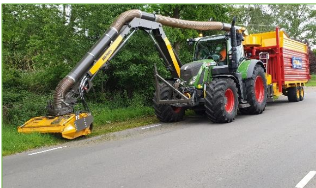
Figuur 3.2 maai- en zuigcombinatie