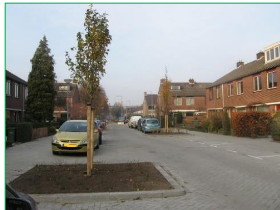
Figuur 2.7 goede beheerstechnische inrichting.