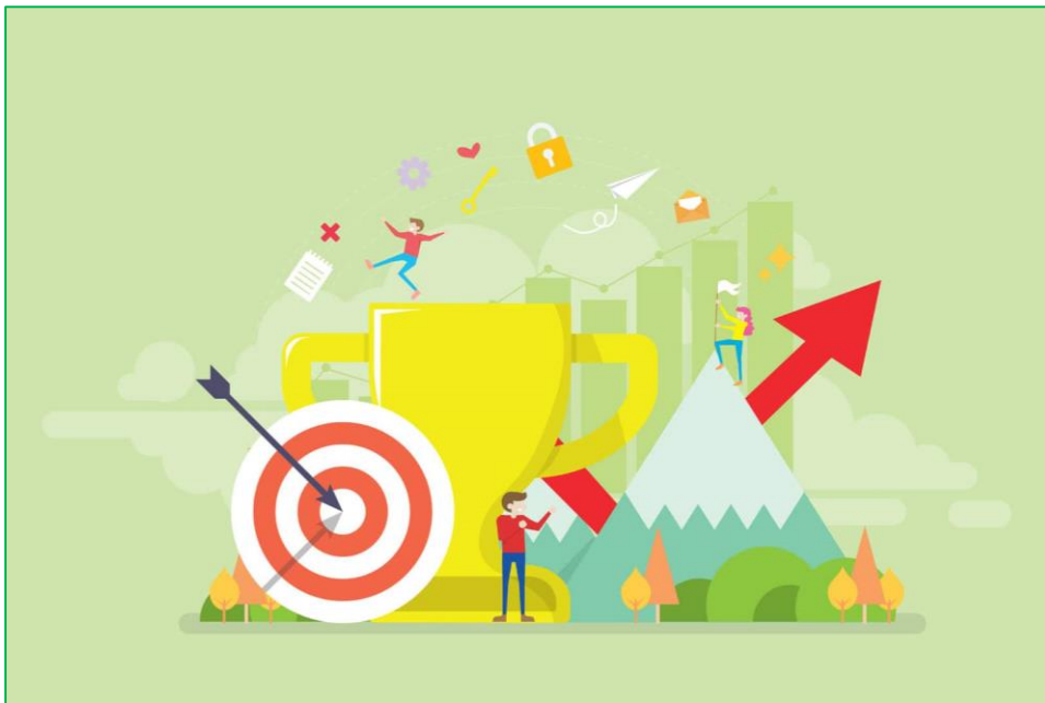
Figuur 1.1 veel doelen bereiken vanuit verschillende invalshoeken. Bron: Nico Oud

Aangezien dit uitvoeringsplan ook een uitvloeisel is van het KOG, moet het KOG als beleid worden vastgesteld, alvorens dit uitvoeringsplan kan worden vastgesteld.