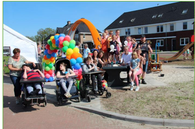
Figuur 2.12 Ontmoeten, spelen, sporten