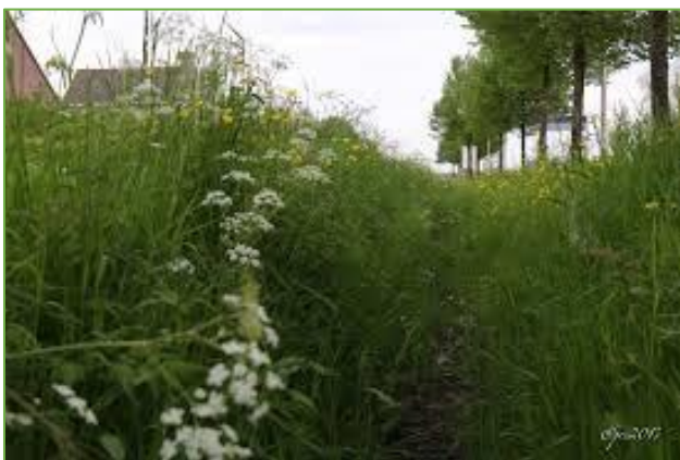
Figuur 3.6 natuurlijke vegetatie in droge sloot