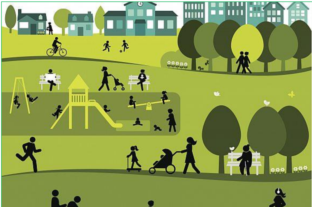
Figuur 2.1 leefbaarheid: aangenaam klimaat, gezondheid, veiligheid en sociale cohesie.

Voor meer tevredenheid over de leefomgeving van inwoners en voor een sterke sociale cohesie is het van belang inwoners bij plannen te betrekken en te communiceren waarom bepaalde keuzes gemaakt worden. Hierdoor ontstaat ook bij de inwoners meer verantwoordelijkheidsgevoel voor de kwaliteit van de openbare ruimte. Bij alle projecten die verderop in dit uitvoeringsplan staan omschreven wordt getracht de inwoners, kernraden en andere belanghebbenden zoveel mogelijk te betrekken. Een groot deel van deze projecten zijn immers al initiatieven vanuit de inwoners en kernraden zelf.