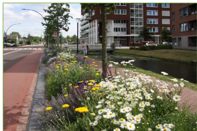
Figuur 2.17 goed te onderhouden groen met een bijdrage aan meer biodiversiteit en leefbaarheid