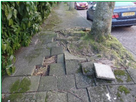
Figuur 2.6 geen beheerstechnische inrichting.

Communicatie, zowel intern als extern, is een vereiste; door plannen integraal te behandelen kunnen veel problemen in het beheer en onderhoud voorkomen worden. Daarnaast moeten ook de wensen en verzoeken vanuit de samenleving ingewilligd worden. Er moet een goede afstemming komen tussen wat wenselijk is vanuit de samenleving en wat professioneel gezien het beste is; Een openbare ruimte waarin iedereen zich thuis voelt; de professional en de recreant.