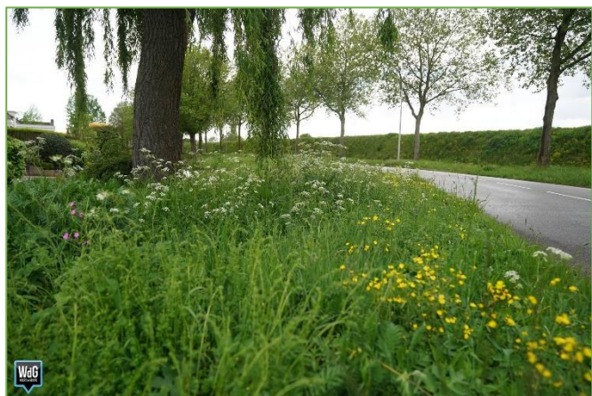
Figuur 2.13 kruidenrijke berm

Dit plan behelst maatregelen voor de komende vier jaar o.b.v. éénmalige financiële middelen. Na deze vier jaar moet deze nieuwe manier van beheer geëvalueerd worden en eventueel structureel worden doorgezet.