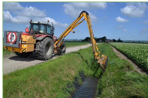
Figuur 3.4 sloten korven