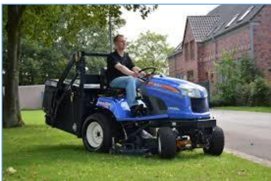
Figuur 3.5 wadi's worden wekelijks gemaaid en het maaisel wordt opgevangen en afgevoerd