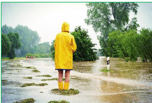
Figuur 2.4 klimaatverandering; hevige regenval.

Bij het toe te passen sortiment bomen en andere beplantingsvormen dienen de eigenschappen van de toe te passen beplanting goed afgestemd te worden op de veranderende groeiomstandigheden en weersomstandigheden. Wetenschappers geven aan dat het klimaat in Nederland over 40 jaar vergelijkbaar is met de situatie nu in de omgeving van Parijs. Dat houdt o.a. in dat een deel van de inheemse vegetatie in Nederland aan het verdwijnen is. Daarnaast zijn de grote aantastingen in de inheemse vegetatie als iepenziekte, watermerkziekte, bacterievuur, essentaksterfte en insectenplagen als eikenprocessierupsen en verschillende spintkevers zeer zorgwekkend voor de nabije toekomst. Daarom is het belangrijk dat de juiste beplantingen toegepast worden in de openbare ruimte. Zodat deze duurzaam uit kunnen groeien en zich staande weten te houden in een veranderend klimaat.