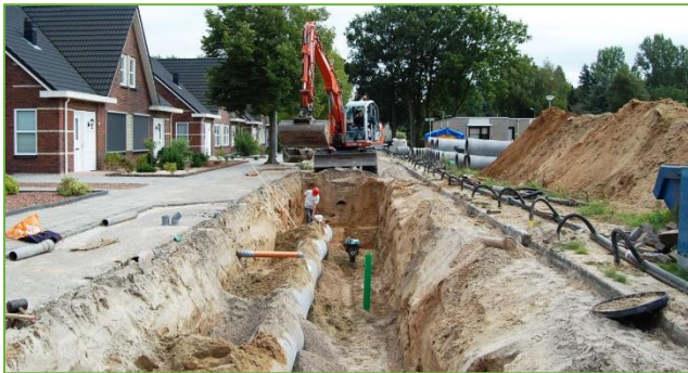
Figuur 2.14 Bij het vervangen van het riool in een straat komt vaak een complete herinrichting kijken. Het KOG kan hier prachtig bij aansluiten m.b.t. groen- en speelvoorzieningen om onder andere hittestress tegen te gaan..

In het kader van klimaatadaptatie is hittestress een factor waarop, door het juist toepassen van groenvoorzieningen binnen een project, heel goed ingespeeld kan worden.