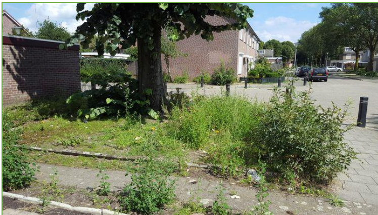
Figuur 2.16 slecht te onderhouden groen