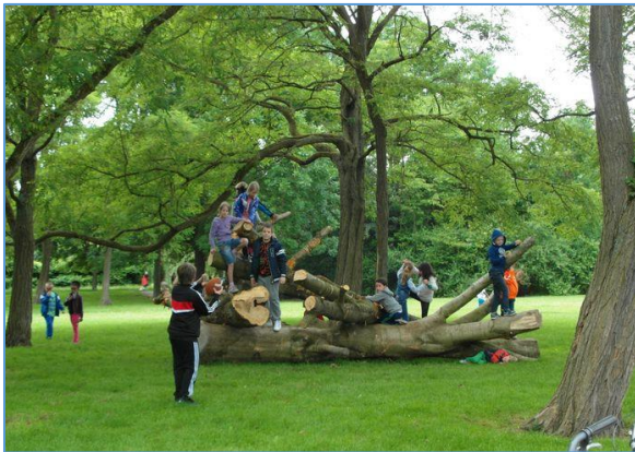
Figuur 2.11 ontmoeten, spelen en sporten.

Het spelen, sporten en bewegen in de openbare ruimte geeft aanleiding tot ontmoeten, dat weer bijdraagt aan de ontwikkeling van burgerparticipatie. Hierdoor wordt aan de ambitie 'leefbaarheid' invulling gegeven.