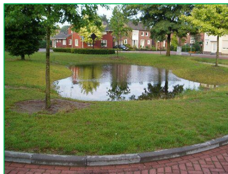
Figuur 2.5 groen en water als klimaatadaptatie.