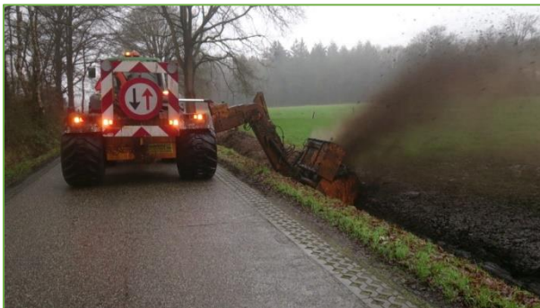
Figuur 3.3 slotenfrees