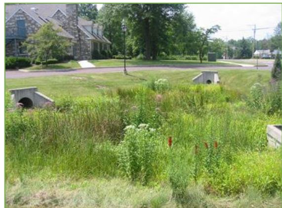
Figuur 3.7 natuurlijke vegetatie in wadi