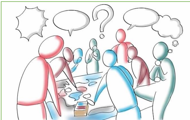
Figuur 2.9 overleg met inwoners.

Vanuit het KOG is er in 2019 een uitvoeringsprogramma opgesteld met projecten die invulling moeten geven aan ambities van de inwoners & dorpsraden van de verschillende dorpen in Tubbergen. Het gaat hierbij voornamelijk om herinrichtingen van de openbare ruimte in het kader van groenvoorzieningen. Deze verzoeken zijn tijdens inloopavonden opgehaald en zijn door professionals getoetst op de ambities vanuit het KOG en worden als nodig geacht. Met name voor de sociale cohesie in de wijk of buurt kan het belangrijk zijn om ingrepen in de leefomgeving door te voeren; denk hierbij aan overlast van bomen door wortelopdruk en blad- en vruchtval, of 'donkere hoekjes' met beplantingen die zorgen voor een onveilig gevoel of situatie. Naast bovenstaande verzoeken & wensen vanuit de kernen zijn in het uitvoeringsprogramma projecten opgenomen vanuit professioneel oogpunt. Binnen de projecten is met name leefbaarheid een belangrijke ambitie. Bij de inrichting wordt uiteraard klimaatadaptatie, biodiversiteit en een beheerstechnische inrichting meegenomen in het ontwerp.