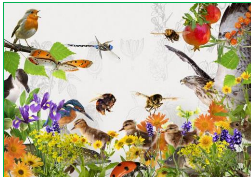
Figuur 2.3 biodiversiteit.