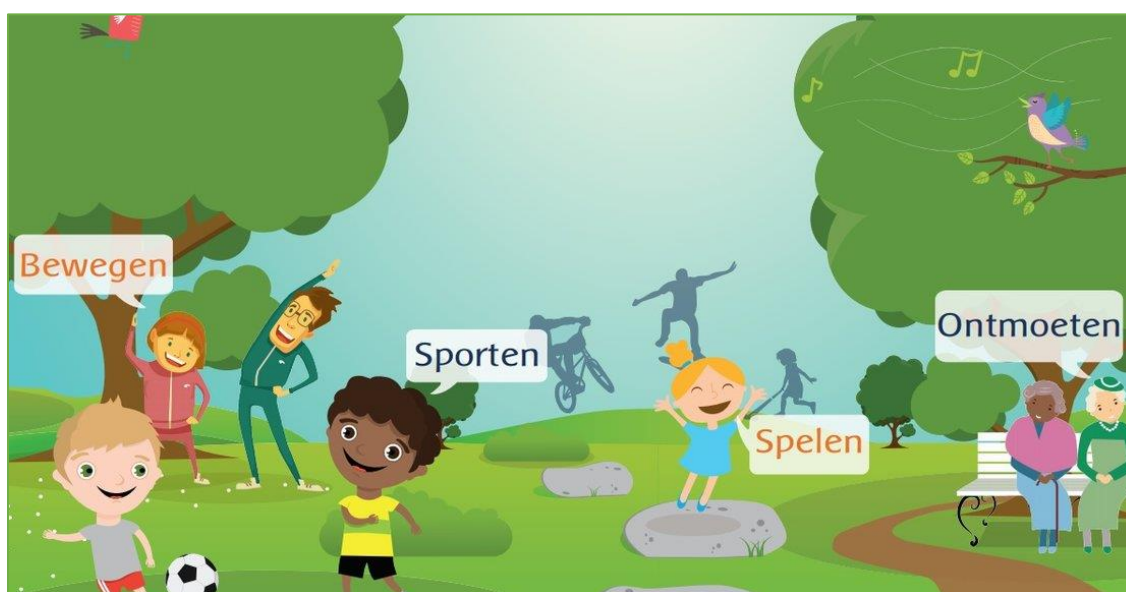
Figuur 3.1 sporten, spelen en ontmoeten

Voor ontmoeten, spelen en sporten is over vier jaar 97.500 euro benodigd. Per jaar is dit gemiddeld 24.300 euro.