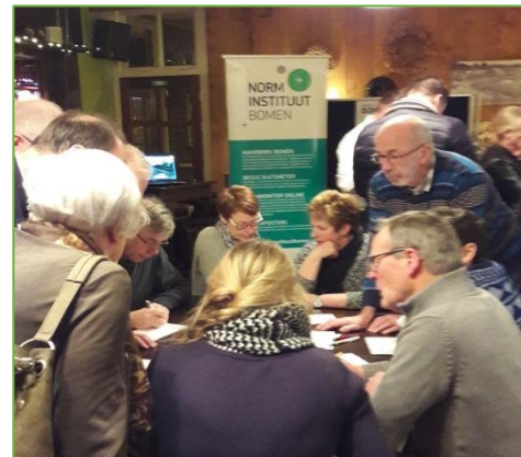
Figuur 2.10 inloopavond.