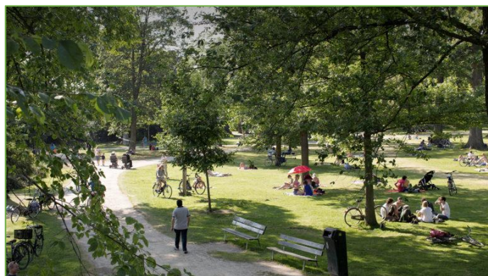
Figuur 2.15 Groen zorgt voor verkoeling tegen hittestress