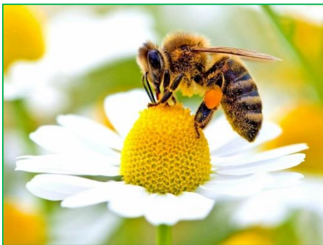
Figuur 2.2 biodiversiteit.

Naast de overige functies van het groen levert deze uitbreiding van het sortiment ook een grote bijdrage aan kwaliteit van het groen. Door de kleurenrijkdom van bladeren en beplantingen vergroot ook het aanbod van voedingsstoffen voor dieren en insecten.