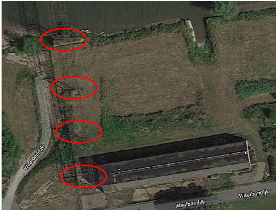
Figuur 1 Kraanbaan waar op de pilaren de tijdelijke vloermuiskasten zijn aangebracht.