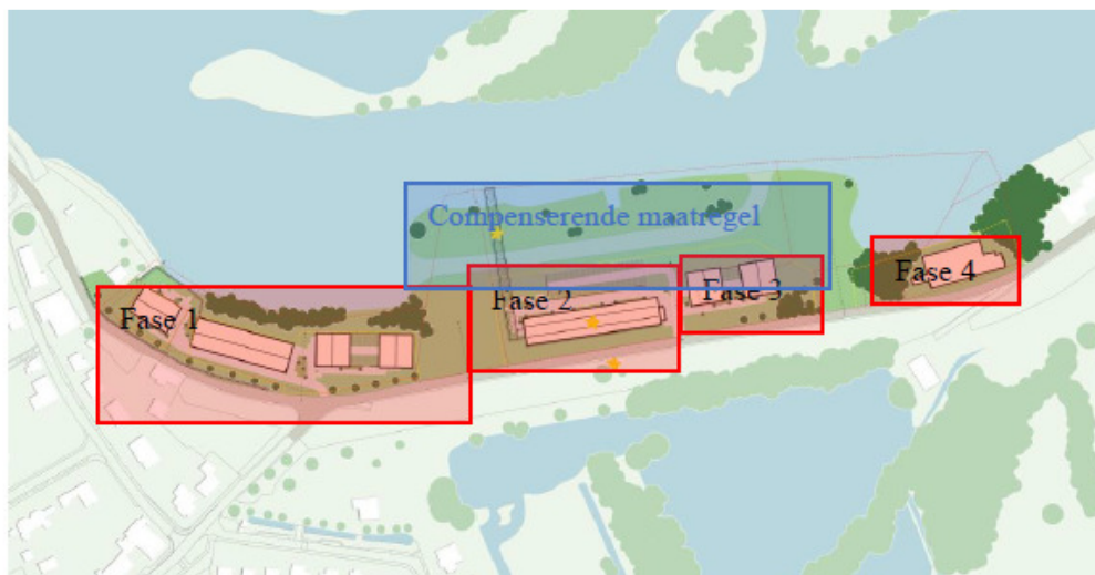
Figuur 2 Plangebied van deze ontheffing betreft fase 1 en 2. Voor de compenserende maatregel graven nevengeul (blauw) is aangegeven dat er voor soorten geen effecten zijn in het kader van de Wnb. Fase 3 en 4 worden indien nodig apart aangevraagd.