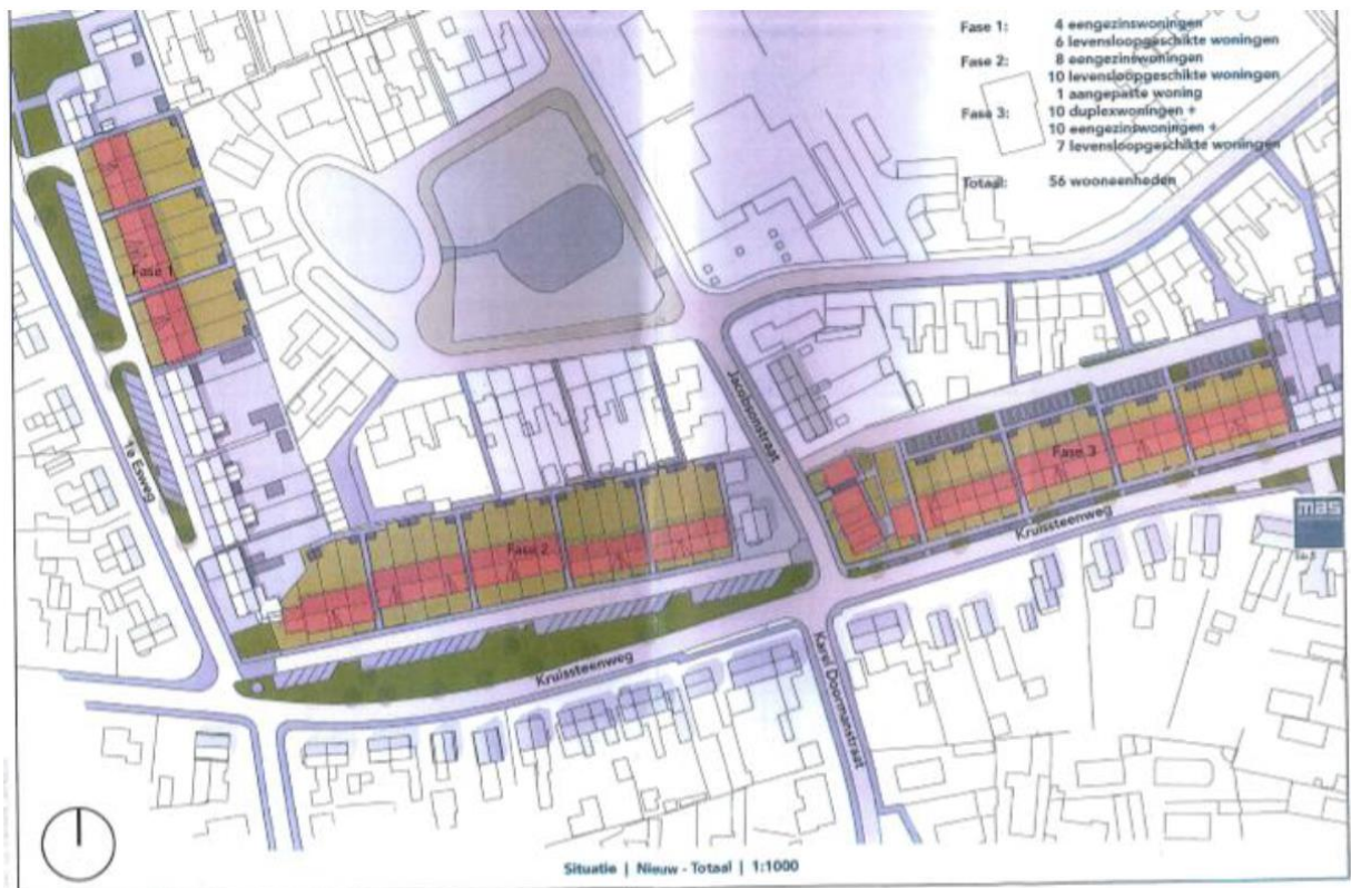
Nieuwe situatie plangebied