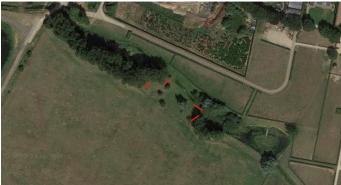
Figuur 1: Locaties van de tijdelijke voorzieningen voor kleine marterachtigen (rood).

Figuur 2: zie separate document van de inrichtingstekening van de uit te voeren werkzaamheden en mitigerende maatregelen gevoegd bij dit besluit.