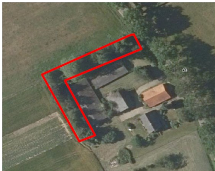
Figuur 3. Locatie van de te behouden beplanting waarin de alternatieve verblijfplaats voor de steenmarter wordt gerealiseerd.

De landschappelijke beplanting rondom de te slopen stal blijft behouden. Deze 4-5 meter brede strook met inheemse bomen en struiken biedt voldoende mogelijkheden tot het realiseren van een verblijfplaats. Het alternatieve steenmarterverblijf bestaat uit twee pallets. De gesloten delen zijn van elkaar afgekeerd. De pallets worden door middel van een standaard stoeptegel iets van de bodem opgetild om de duurzaamheid te garanderen. Deze pallets worden afgedekt met een dichte plaat die vervolgens wordt afgedekt met een zeil. Zodat er een droge ruimte ontstaat. Tussen de pallets wordt wat stro aangebracht. Over deze pallets worden korte boomstammen gelegd die naar boven toe steeds fijner worden. Op deze wijze worden de pallets overdekt met tak en tophout. Tussen de stammen en takken blijven voldoende openingen aanwezig om de steenmarter toegang te verlenen tot de ruimte onder de twee pallets.