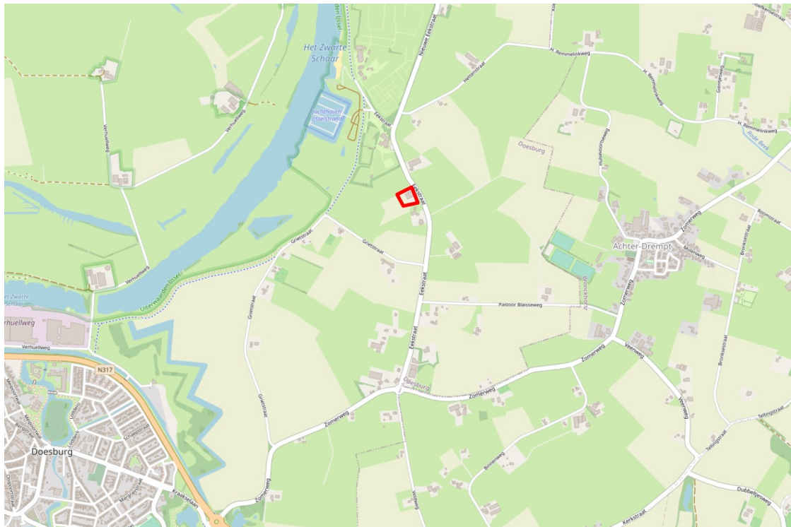
Figuur 1. Globale ligging plangebied Ekstraat 13 te Doesburg (rode kader).