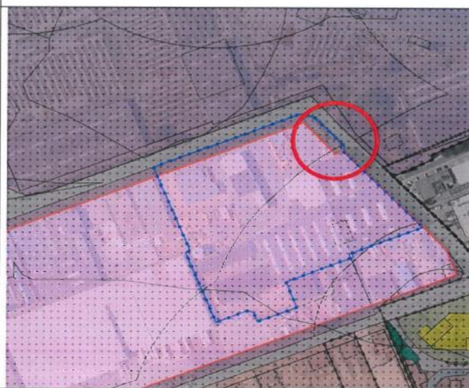
Fragment uit het voorontwerpplan met daarop in het paars ingekleurd het bebouingsvlak. Het bebouingsvlak moet in overeenstemming worden gebracht met het uitbreidingsplan.