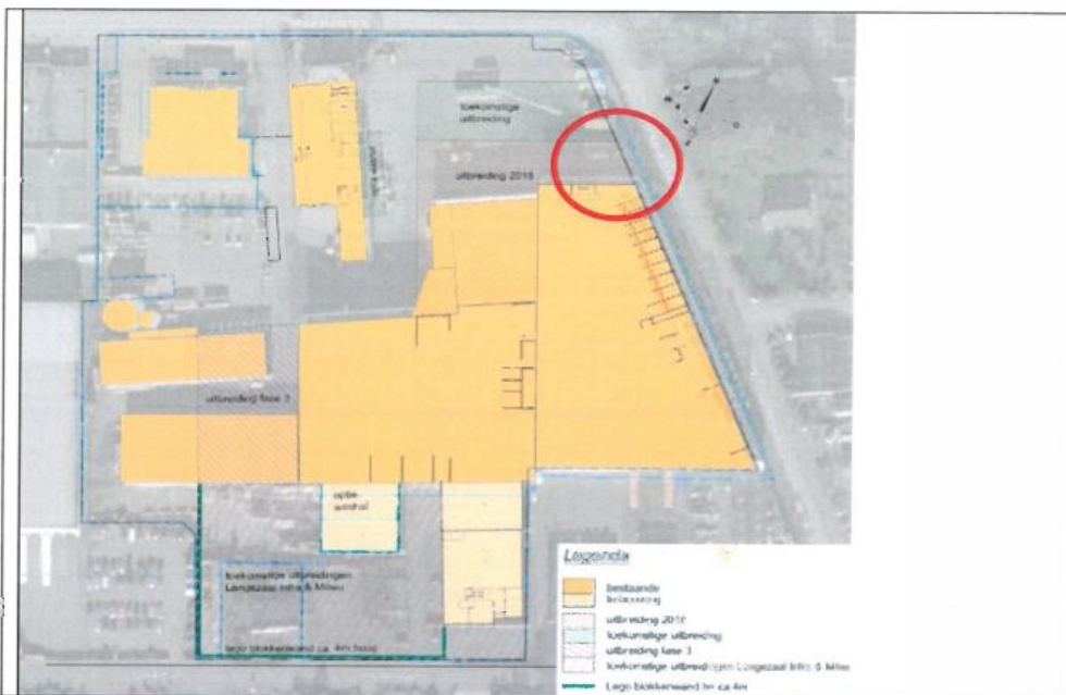
Figuur uit de ruimtelijke onderbouwing behorende bij de aanvraag omgevingsvergunning met daarop het uitbreidingsplan weergegeven.