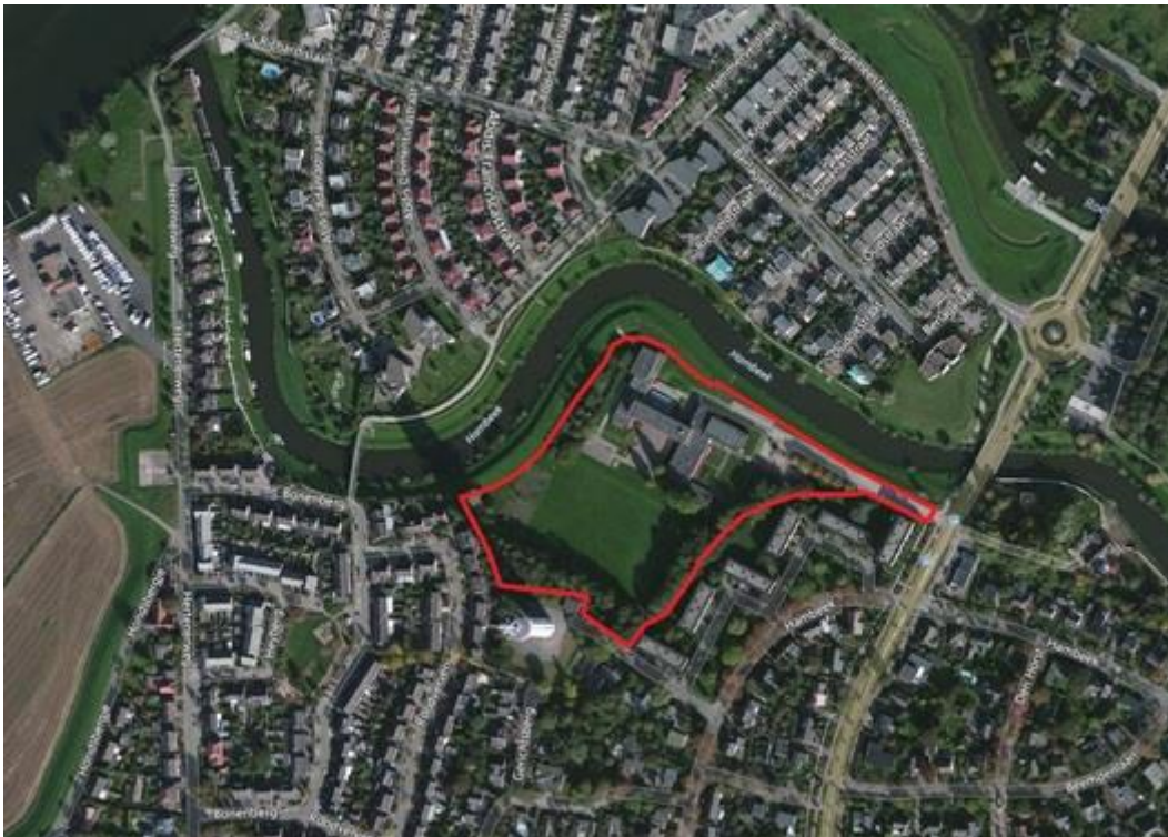
Figuur 2: begrenzing plangebied met luchfoto

Onderhavige vergunningsaanvraag is besproken op 22 juli 2020 met Ralph Theunissen en Geert van Lankveld van het Waterschap Limburg.