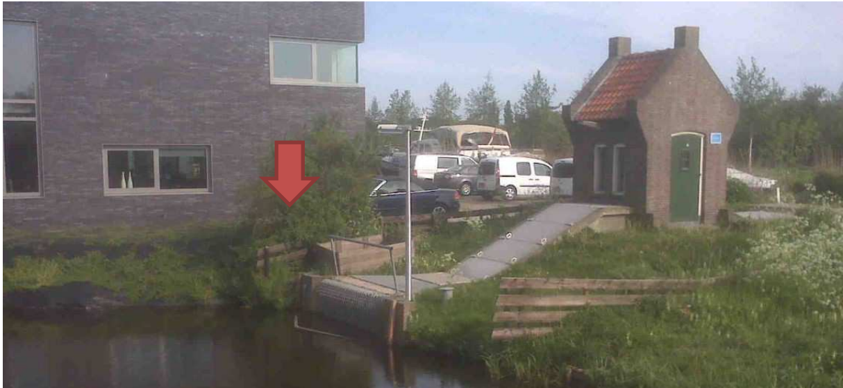
Afbeelding 3 nieuwe locatie poldergemaal

In de directe nabijheid van het huidige gemaal wordt een nieuw poldergemaal gebouwd, zie afbeelding 3. Het nieuwe gemaal wordt tevens uitgerust met een automatische krooshekreiniger om kroosvuil te kunnen verwijderen.