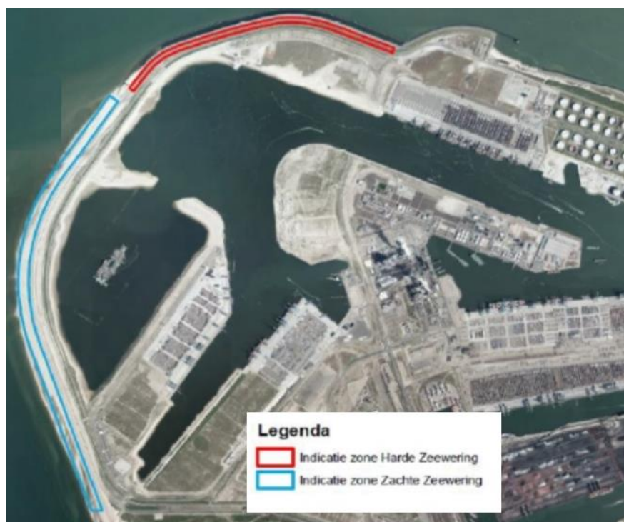
Figuur 1, ligging plaatsingszones windturbines Maasvlakte 2

Besluitvormers en insprekers lezen in de eerste plaats de samenvatting van het MER. Daarom verdient dit onderdeel bijzondere aandacht. De samenvatting moet als zelfstandig document leesbaar zijn en een goede afspiegeling zijn van de inhoud van het MER.