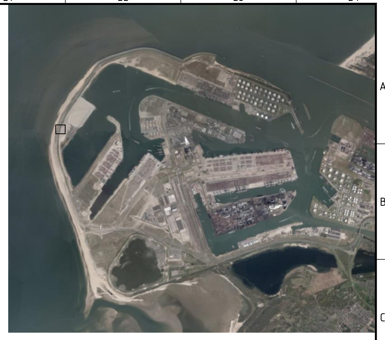
Overzichtskaart Schaal 1:75.000