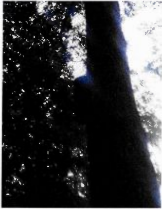
Fotocompilatie alternatieve (paar-) verblijfplaatsen vleermuizen