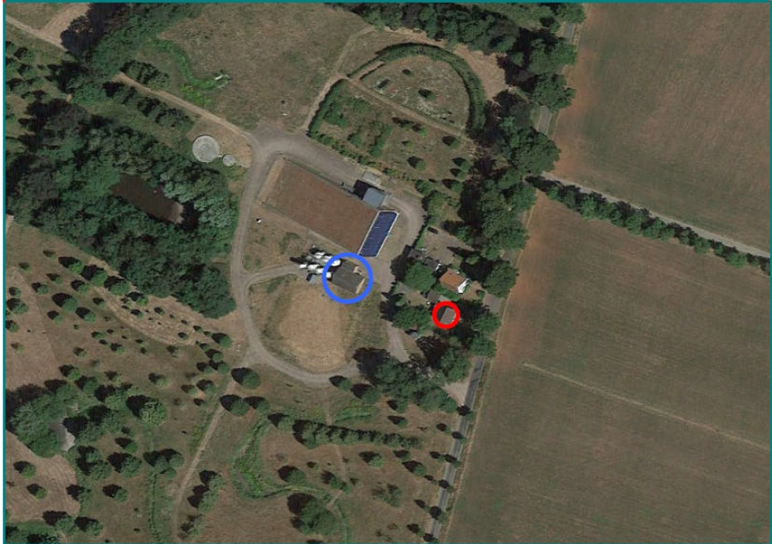
Figuur 3. Oude pompgebouw (blauwe cirkel) waarin de permanente voorzieningen voor de laatvlieger worden gerealiseerd ten opzichte van de huidige verblijfplaats van de laatvlieger in de te slopen woning (rode cirkel).