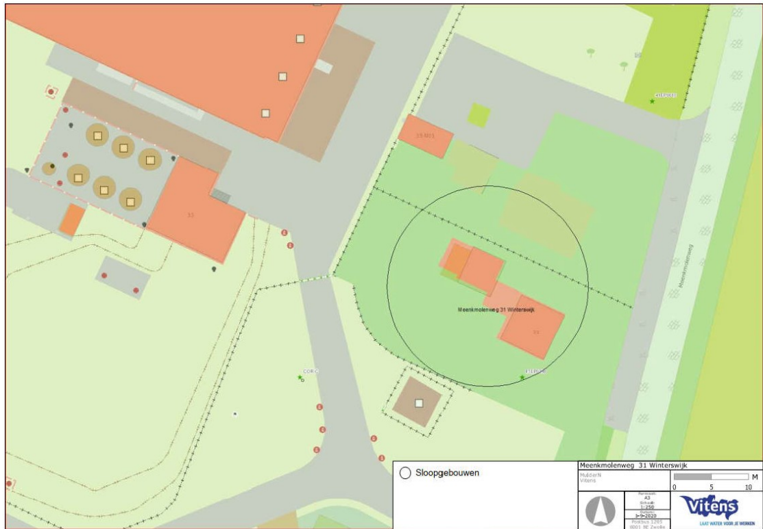
Figuur 2. Overzicht te slopen bebouwing aan de Meenkmlenweg 31 te Winterswijk-Corle.