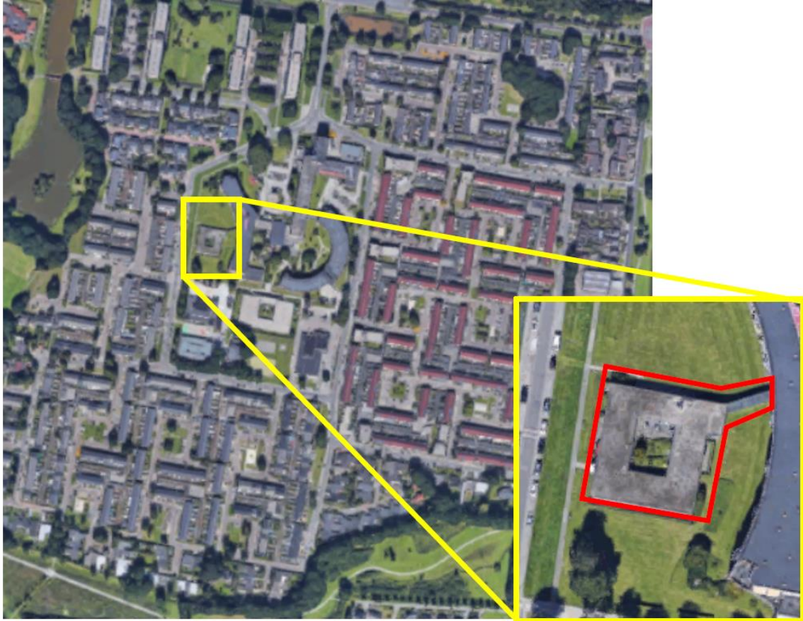
Ligging (geel omlijnd) van het plangebied (rood omlijnd) in de omgeving.

De Patio is opgetrokken uit baksteen, is maximaal 3 meter hoog, bestaat uit één bouwlaag, heeft een plat dak en een kunststof boeiboord. Het gebouw is al langere tijd niet onderhouden; kozijnen zijn beschadigd of zijn aan het verrotten, het boeiboord wijkt op sommige plekken af van de gevel en de dakrand loopt niet meer recht. Verder zijn er geen openingen, zoals open stootvoegen en ventilatievoegen, aanwezig in het gebouw.