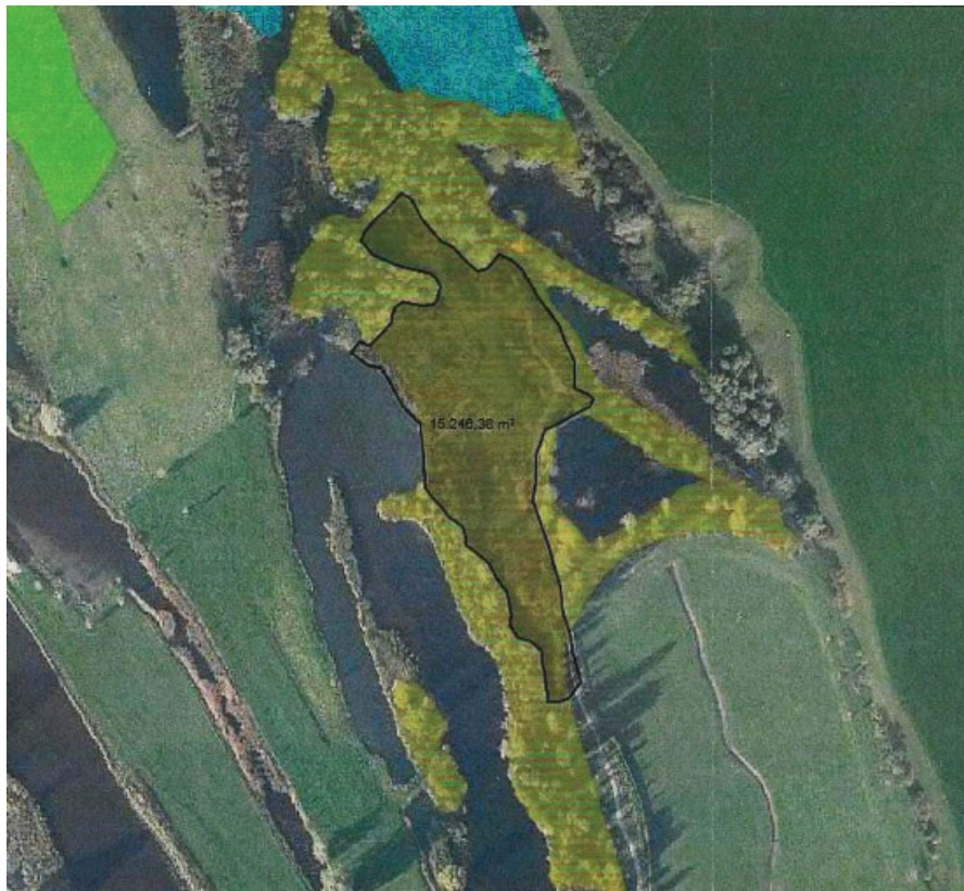
Figuur 1 Gevelde 1,3 ha aan wilgen