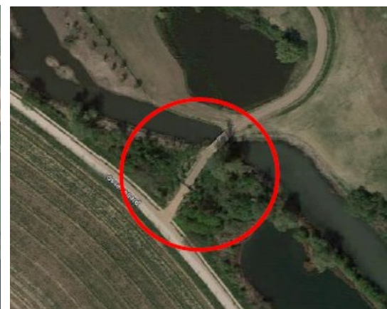
Figuur 2 De ligging van het zachthoutoibos (l) en de gerealiseerde toegangsweg en brug (r).