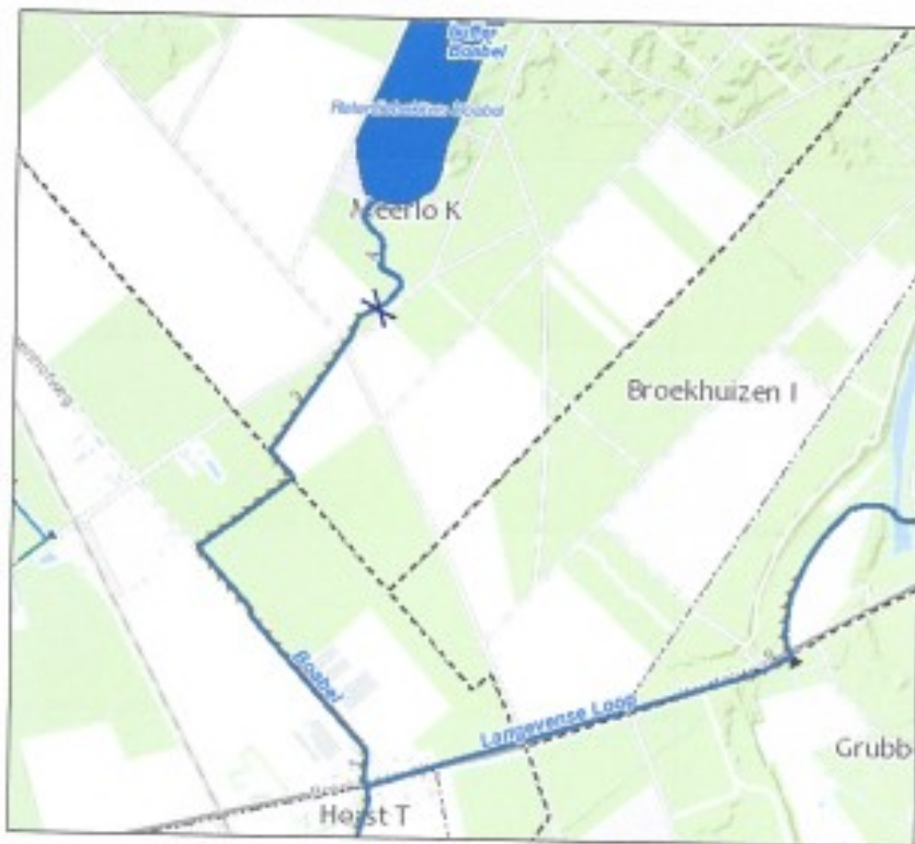
Kaart Deckers-Weijs onttrekking De Boabel