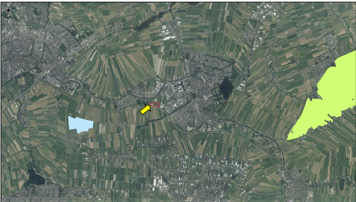
Figuur 9. Ligging onderzoekslocatie ten opzichte van Natura 2000.

De onderzoekslocatie is niet gelegen binnen de grenzen, of in de directe nabijheid van een gebied dat aangewezen is als Natura 2000. Het meest nabijgelegen Natura 2000-gebied, De Wilck, bevindt zich op circa 4 kilometer afstand ten westen van de onderzoekslocatie (zie figuur 9).