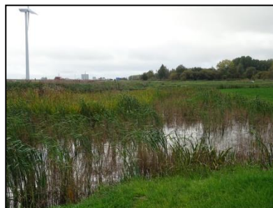
Figuur 7. Aangrenzend het zuidwestelijke deel van het plangebied is een plaatselijke verbreding van de watergang.