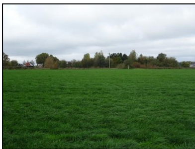
Figuur 3. Het gehele plangebied bestaat uit grasland met sloten.