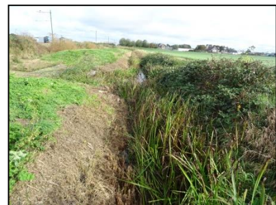
Figuur 5. Verruigd gebied aan noordzijde van de planlocatie.