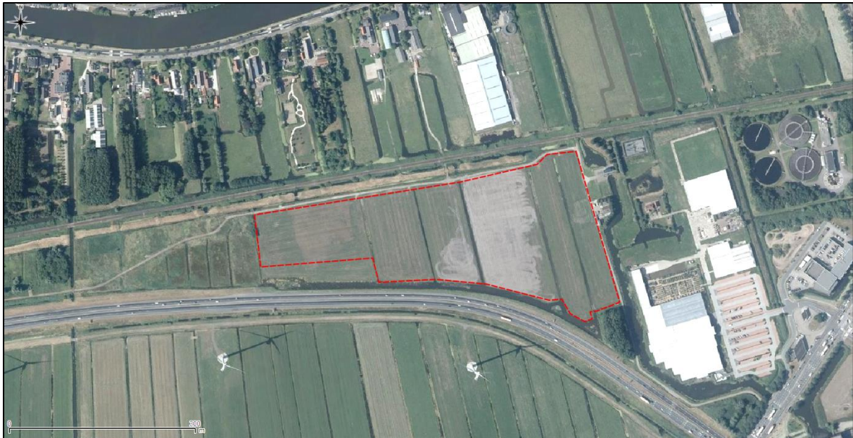
Figuur 2. Luchtfoto onderzoekslocatie en directe omgeving.