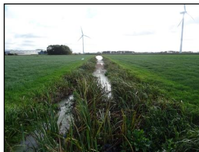
Figuur 4. Watergangen die van noord naar zuid door het plangebied lopen.