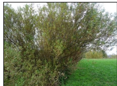
Figuur 8. De enige struiken op de planlocatie zijn te vinden op de grens met het westelijke plot.