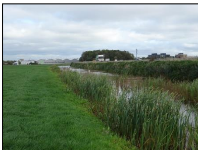
Figuur 6. Watergang ten zuiden van de locatie.