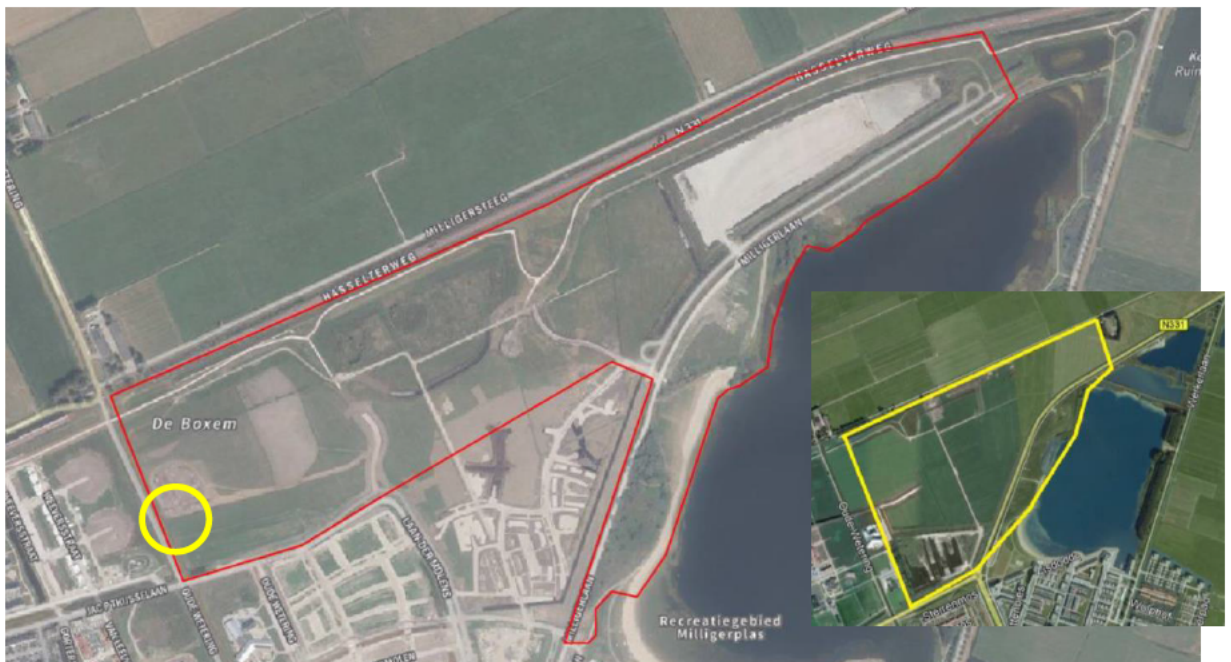
Figuur 1. Plangebied bouwrijp maken Breezicht-Noord (binnen rode lijn). In de inzet is met een gele lijn het eerdere plangebied weergegeven. In de gele cirkel is het slotgedeelte gelegen waarvoor de ontheffing voor grote modderkruiper wordt gewijzigd.

Het plangebied Breezicht-Noord ligt aan de rand van Stadshagen en ten zuiden van de N331 in Zwolle. Het plangebied wordt aan de noordzijde begrensd door de N331 en aan de oostzijde door de Milligerplas. Overige zijden worden begrensd door de watergang 'Oude Wetering' en aanwezige wegen. Het plangebied bestaat uit grasland, oevervegetatie, een zanddepot en diverse sloten die de percelen van elkaar scheiden. Begroeiing is veelvuldig aanwezig op het terrein van het zanddepot, langs de Milligerplas en bestaat voornamelijk uit spontane (ruige) opslag en ruig begroeide perceelsranden. Aanwezige sloten zijn naar verwachting jaarrond watervoerend. Het plangebied is in figuur 1 weergegeven.