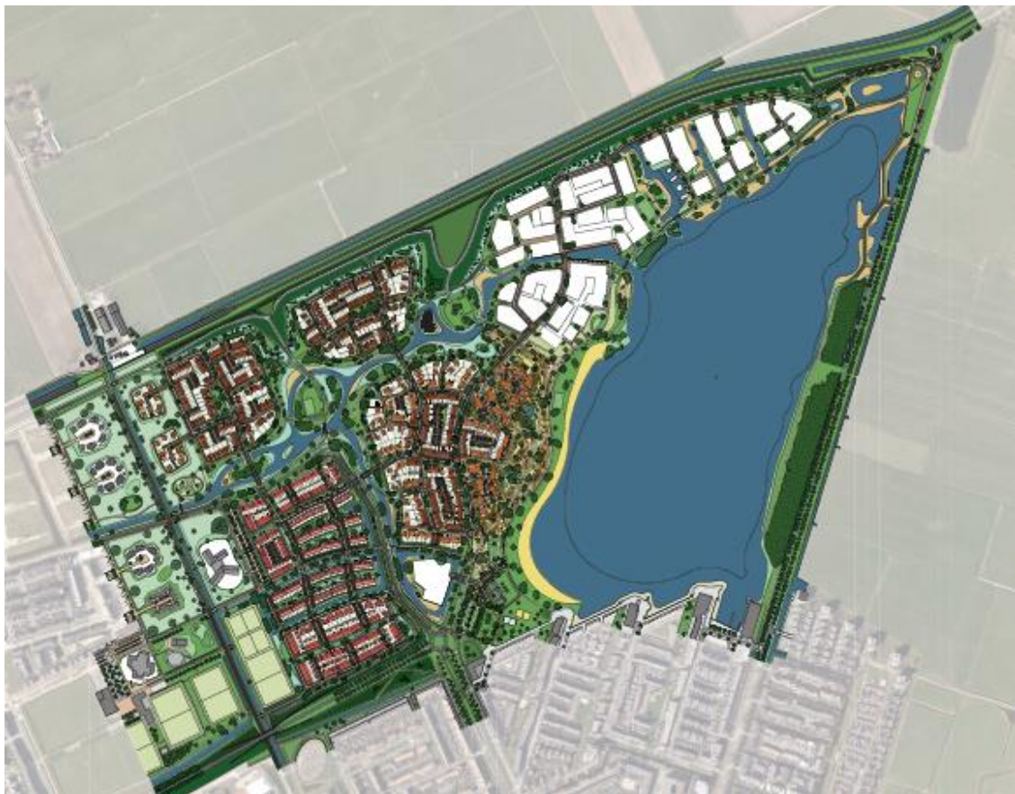
Figuur 2. Inrichtingsschets Breezicht-Noord.

Het bouwrijp maken van het plangebied staat gepland vanaf september 2020. Het realiseren van de woonwijk in Breezicht-Noord wordt gefaseerd uitgevoerd vanaf eind 2020 en duurt naar verwachting circa 5 jaar. De ontheffing wordt aangevraagd voor de periode van september 2020 tot september 2025. Hierbij wordt rekening gehouden met eventuele vertraging door planologische procedures en onverwacht optredende crises.