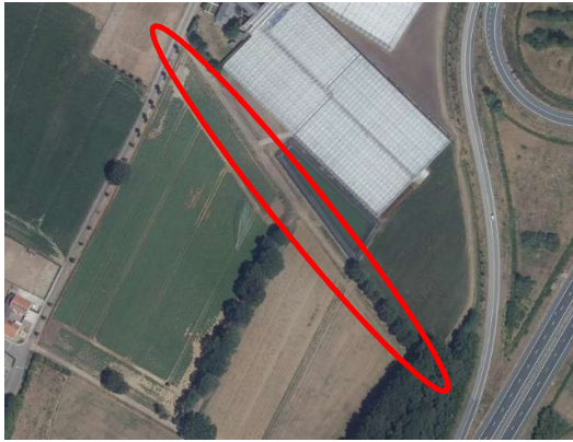
Ligging Belfeldse Leigraaf ten westen van de afrit A73.