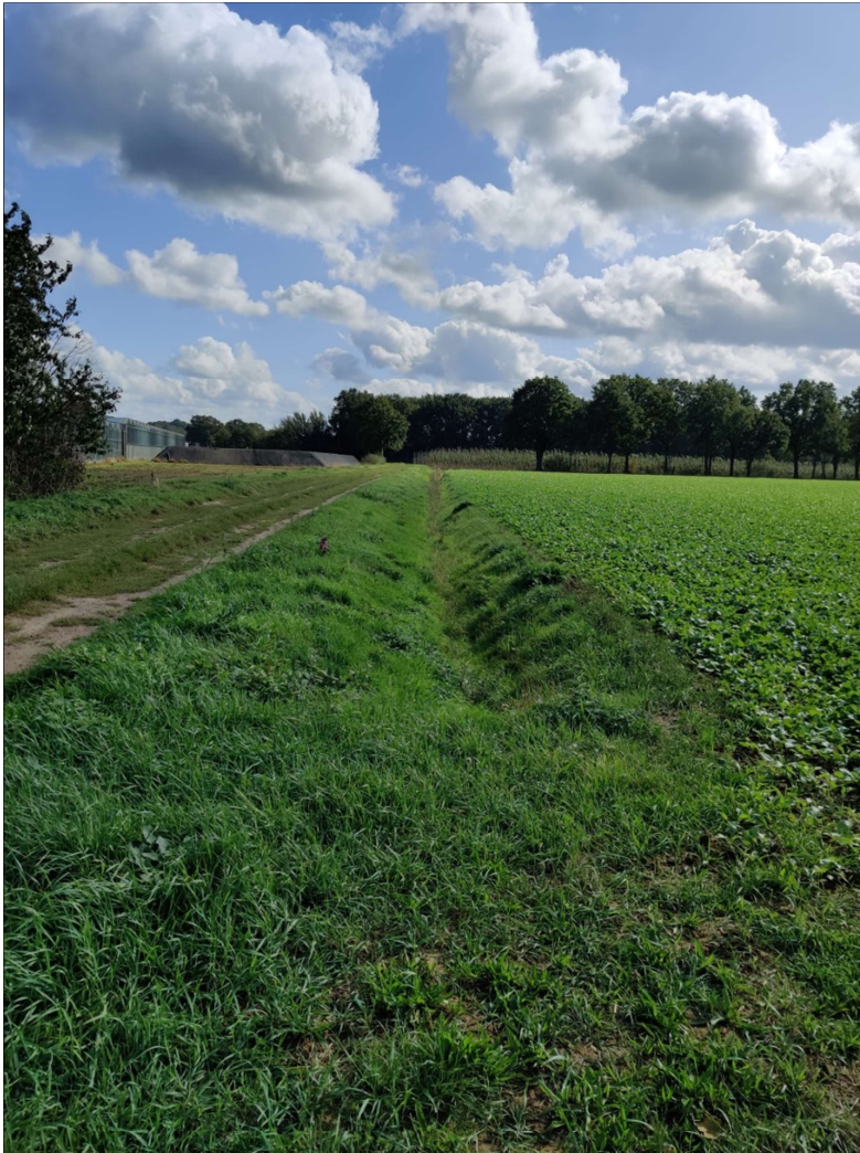
Beeld van de Belfeldse Leigraaf, 27 september 2019.