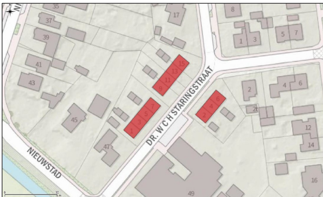
Figuur 2. Projectlocaties in rood.