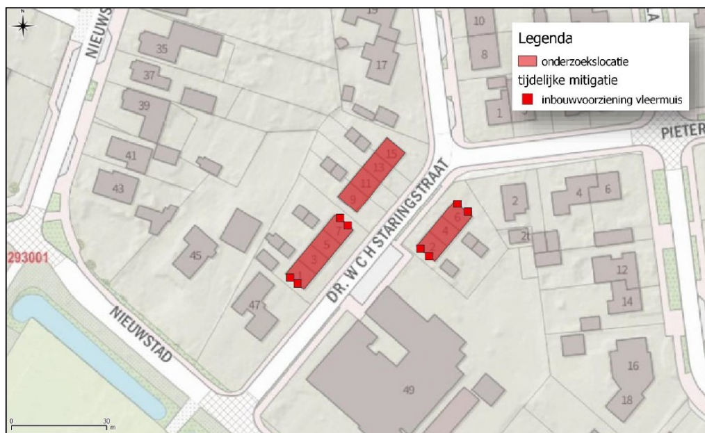
Figuur 4. Verspreiding aan te brengen permanente voorzieningen voor de gewone dwergvleermuis