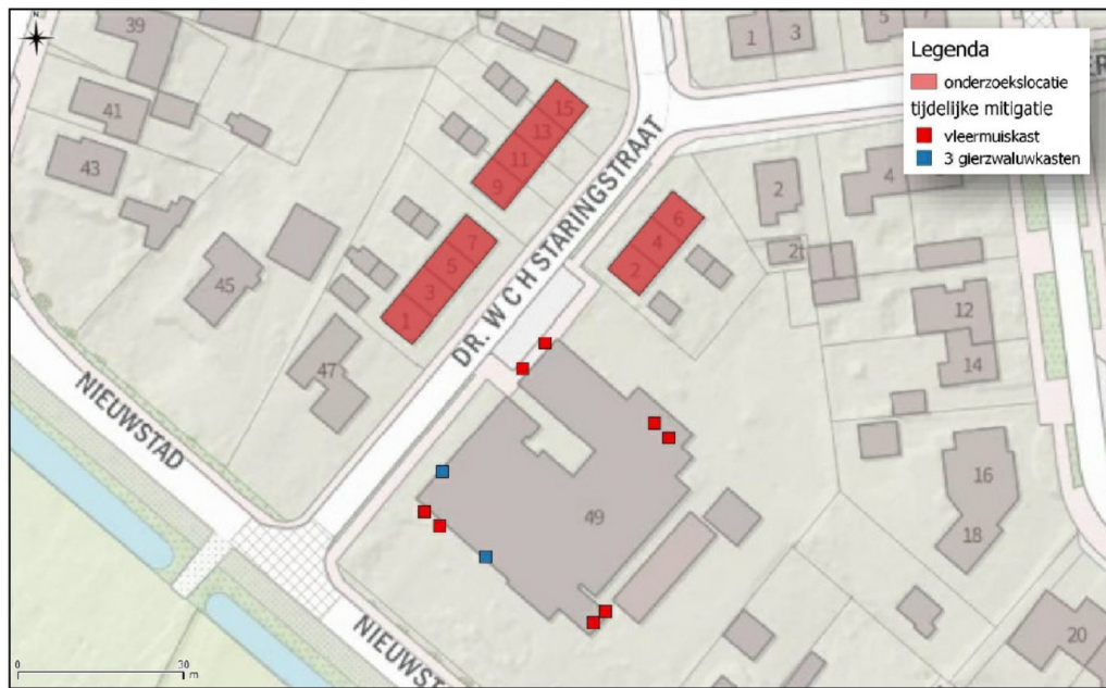
Figuur 3. Verspreiding van de tijdelijke mitigerende maatregelen