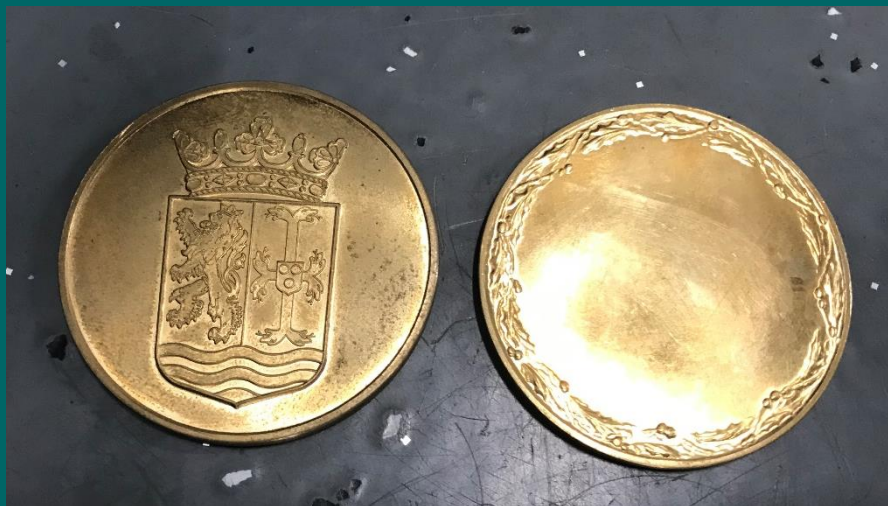
Afb. Erepenning van de gemeente Beekdaelen

Bij de uitreiking wordt aan de ereburger tevens een oorkonde overhandigd waarop de gronden vermeld staan, die hebben geleid tot het toekennen van het ereburgerschap. Aan de erepenning en het ereburgerschap is een draaginsigne (lintje met speld) verbonden, die bij de toekenning wordt uitgereikt.