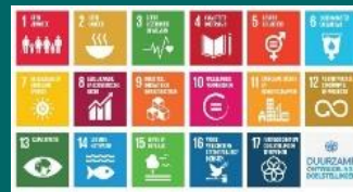
Afb. Global Goals vlag