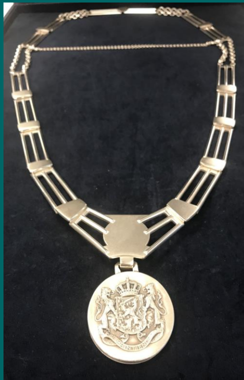
Afb. Ambtspenning en -ketting

De glanzende gepolijste uitvoering benadrukt een moderne visie van de burgemeester en een glanzende toekomst voor Beekdaelen. Aan de keten is een Rijksgekeurd zilveren ambtspenning gemonteerd met op de ene zijde het nieuwe gemeentewapen en op de andere zijde het Rijkswapen in opwaarts reliëf.