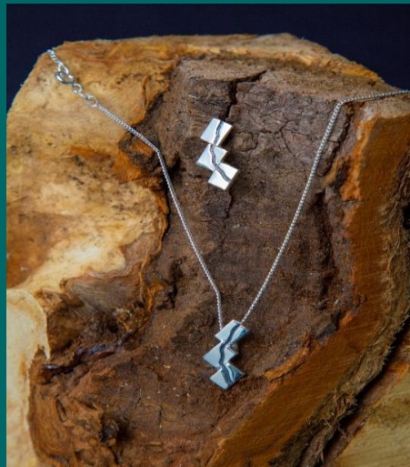
Afb. Meander speld en hanger

De drie vlakken symboliseren de drie voormalige gemeenten, die nu samen Beekdaelen vormen.