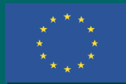
Afb. Europese Vlag