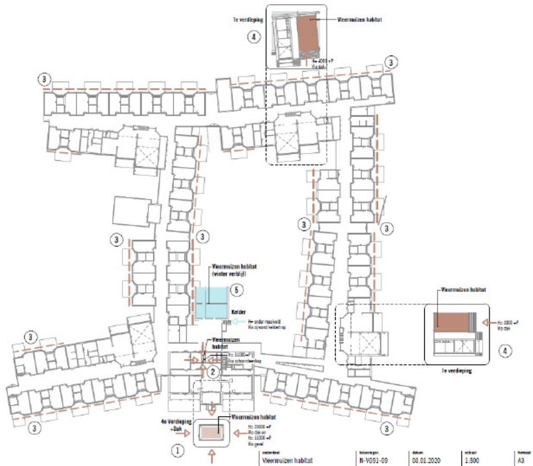
Figuur 2: Permanente mitigatie. De nummers verwijzen naar de nummers in tabel 2.