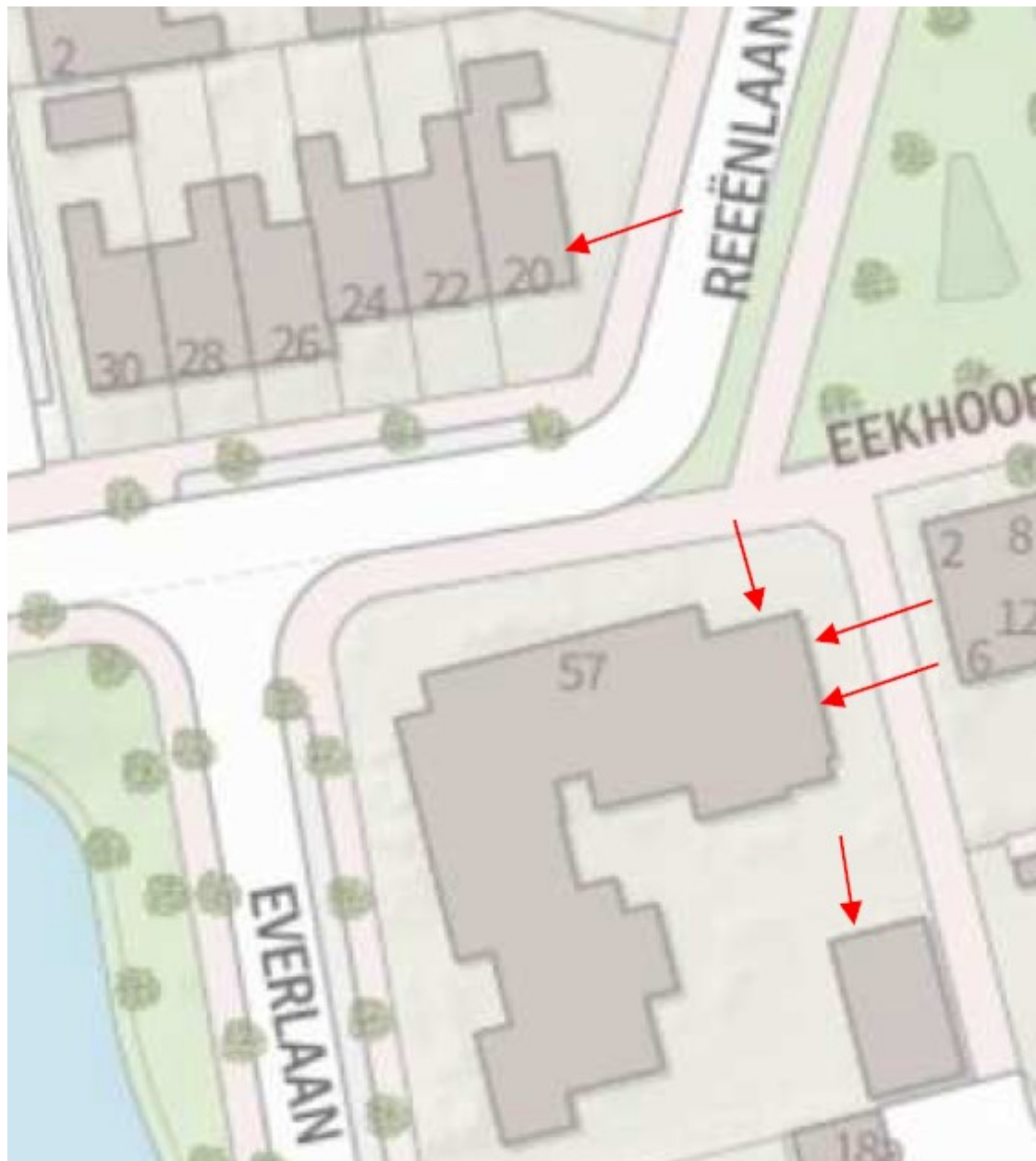
Figuur 2: Locaties tijdelijke mitigatie. Elke pijl staat voor drie huismuskasten.