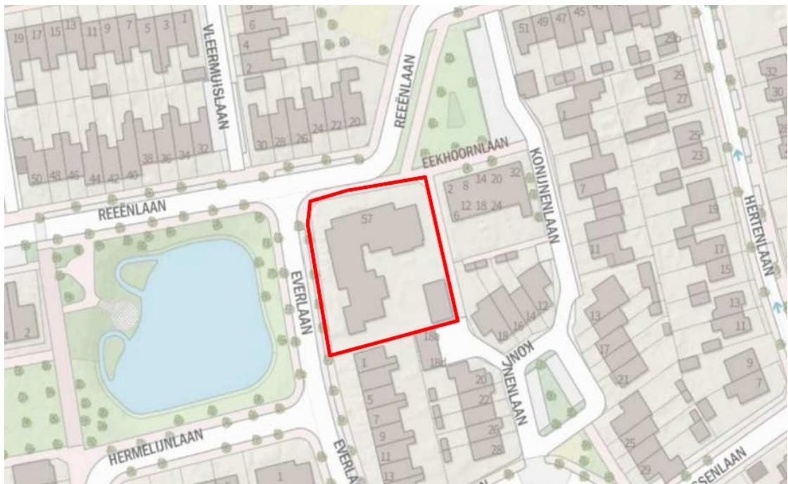
Figuur 1: Plangebied de Bongerd, Reeënlaan 57, Lunteren