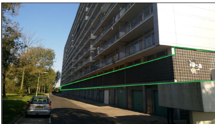
Figuur 2 – locatie van de verblijfplaatsen van gewone dwergvleermuis (groene kader)

Van de gewone dwergvleermuis zijn 4 jaarrond gebruikte verblijfplaatsen vastgesteld. Deze bevinden zich in de stootvoegen die op ongeveer 5 meter hoogte aanwezig zijn in de zwarte gevelstenen op de eerste verdieping van beide gebouwen (zie groene kader in onderstaande afbeelding). Deze gevels zitten aan beide zijden van beide gebouwen en worden ieder als geheel gezien als een jaarronde verblijfplaats (in totaal dus 4 stuks). Elke verblijfplaats wordt door meerdere vleermuizen wordt gebruikt, en binnen elke verblijfplaats wordt er gebruik gemaakt van verschillende invliegopeningen. Mogelijke worden de verblijfplaatsen ook als (massa)winterverblijfplaats gebruikt.