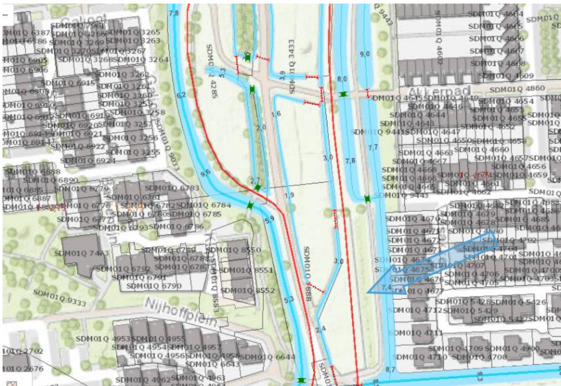
Kadastrale gegevens POL008-zuid