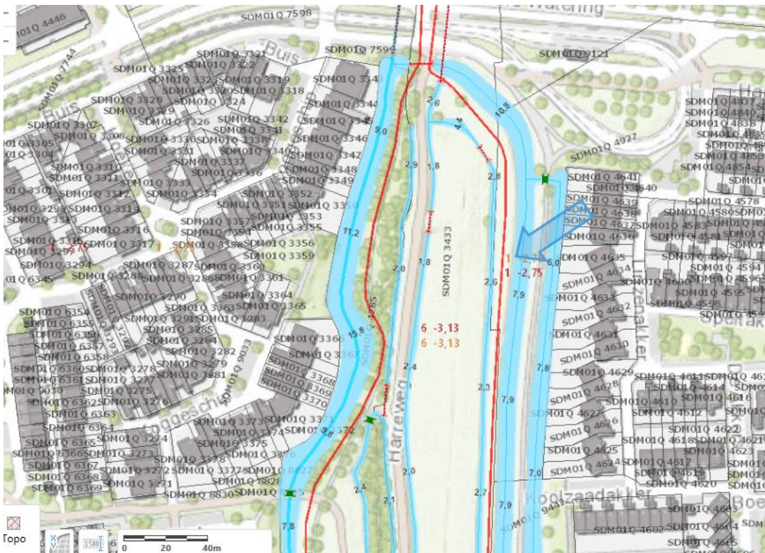
Kadastrale gegevens POL008-noord