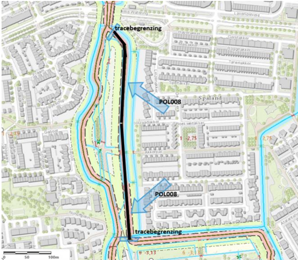
Figuur 1 Ligging Polderkade POL008 Harreweg

Kadetragect POL008 is gelegen in de Poldervaartpolder langs de Harreweg in de gemeente Schiedam. Kadetragect POL008 scheidt twee peilgebieden in de Poldervaartpolder. In bijlage 1 is een overzicht van de kadastrale situatie opgenomen. De kade ligt tussen Slimme Watering en Jaap de Raatpad. Halverwege het tracé kruist de kade het Akkerpad.