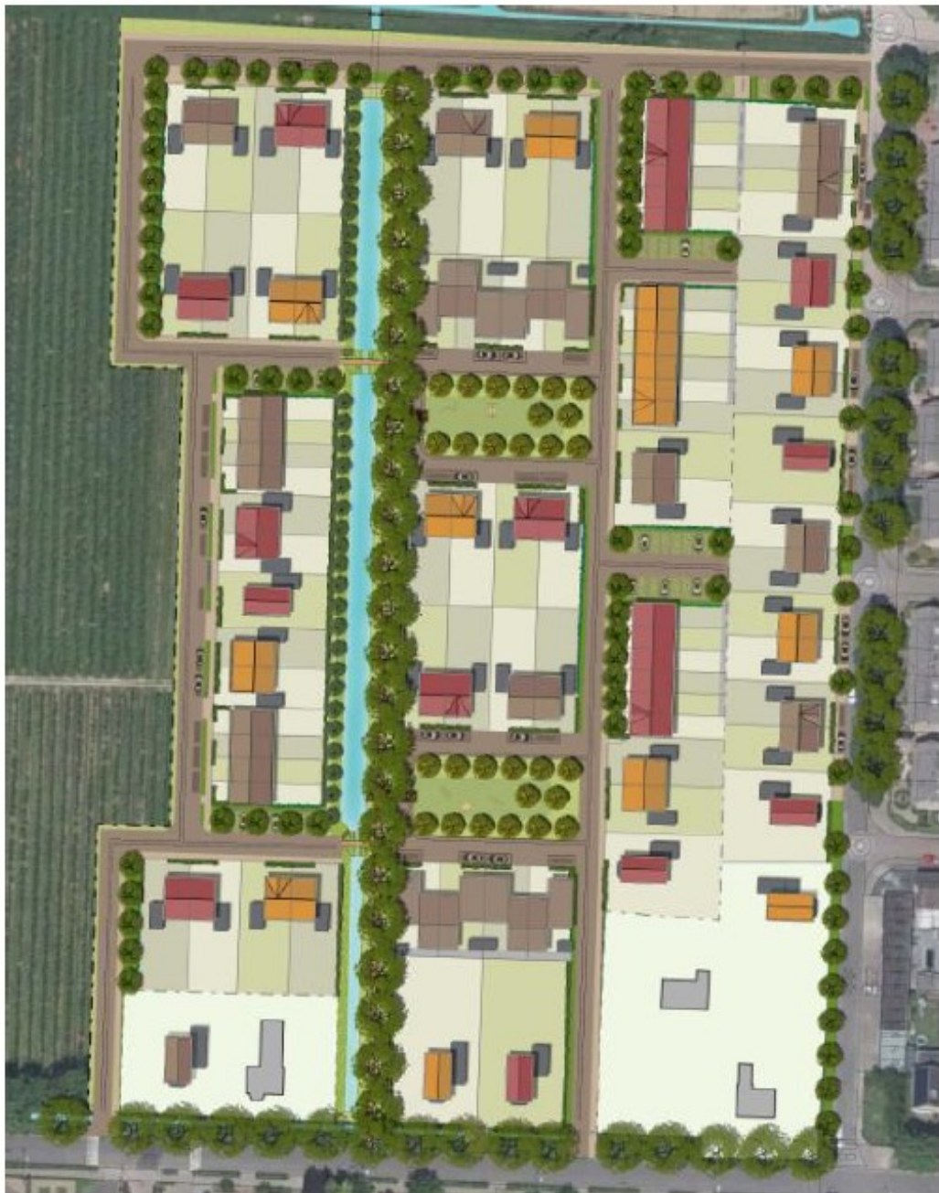
Figuur 1 locatie 86 woningen