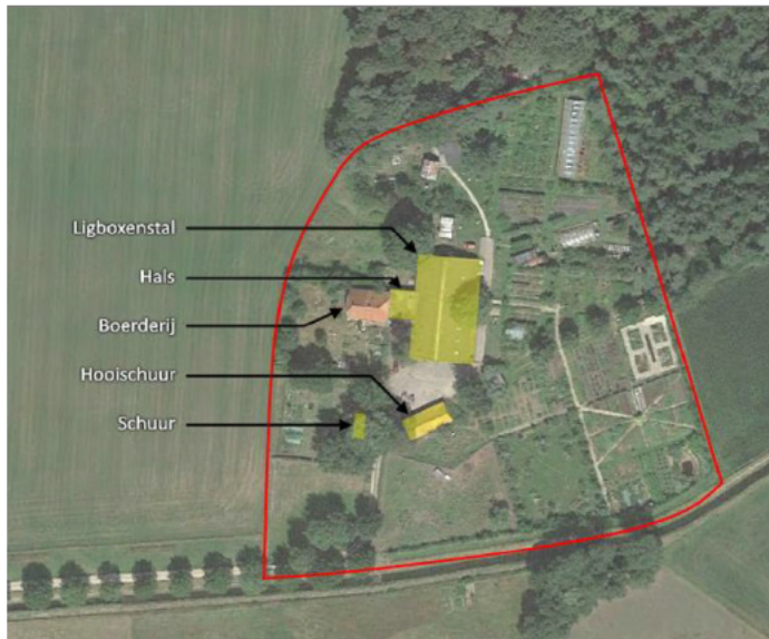
Figuur 1 – huidige inrichting van het projectgebied