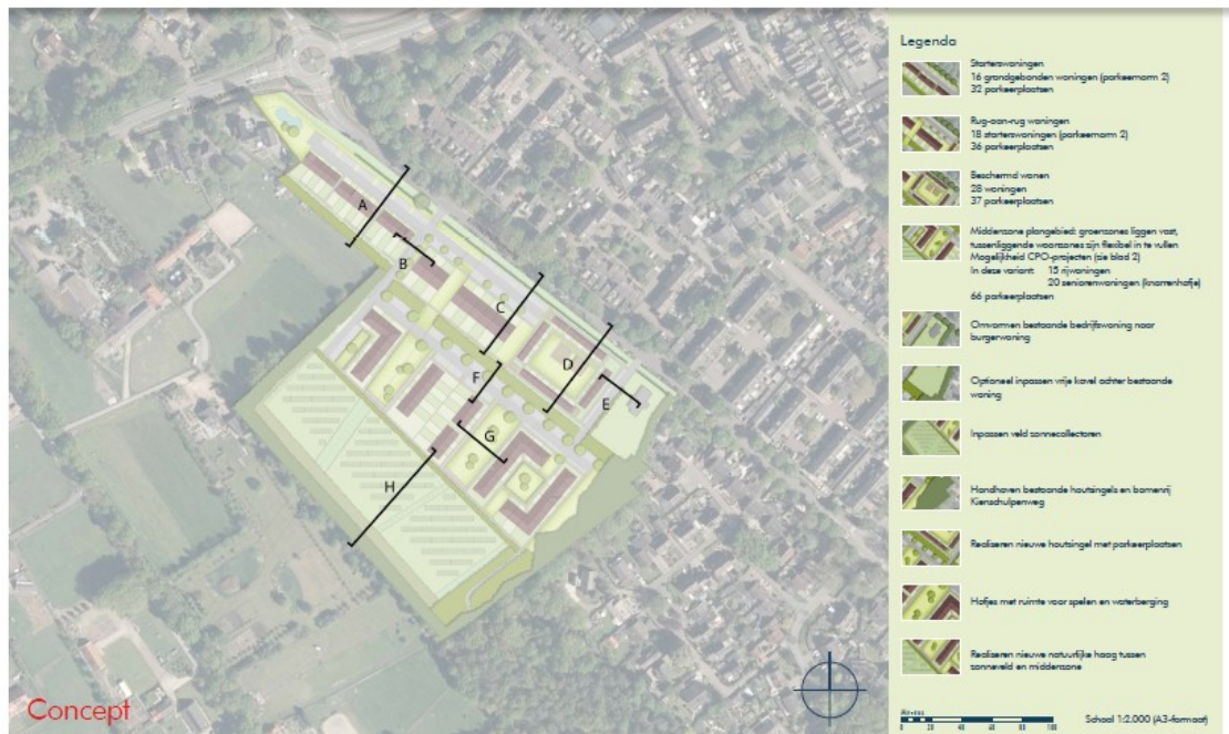
Voorkeursvariant met locaties doorsnedes

Stedenbouwkunding ontwerp Kijktuinen gemeente Nunspeet