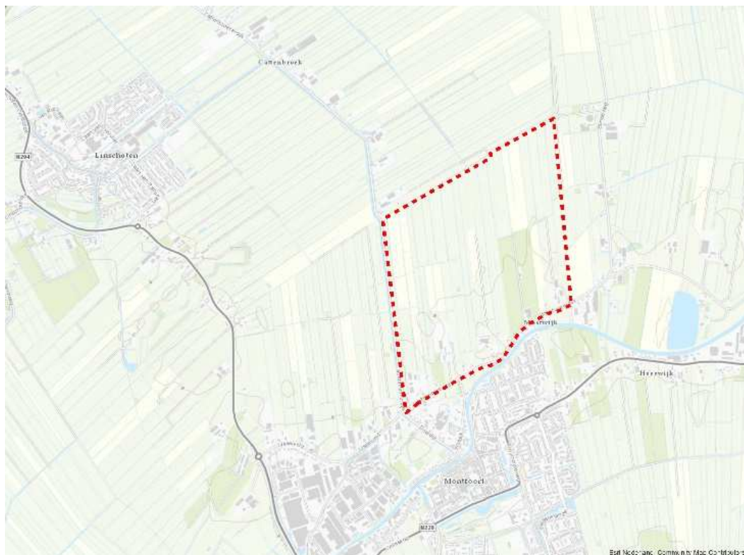
Figuur 1. begrenzing projectgebied 'IJsselveld over de Vaart'

IJsselveld over de Vaart ligt in de gemeente Montfoort tegen de noordwestelijke begrenzing van de bebouwde kom, noordelijk van de Gekanaliseerde Hollandsche IJssel. In het westen wordt het gebied begrensd door de Cattenbroekerdijk en de naastgelegen Montfoortse Vaart. Het betreft het zuidelijke deel van de Linschoterwaard in de polder Rappijnen. Het plangebied is circa 130 hectare groot.