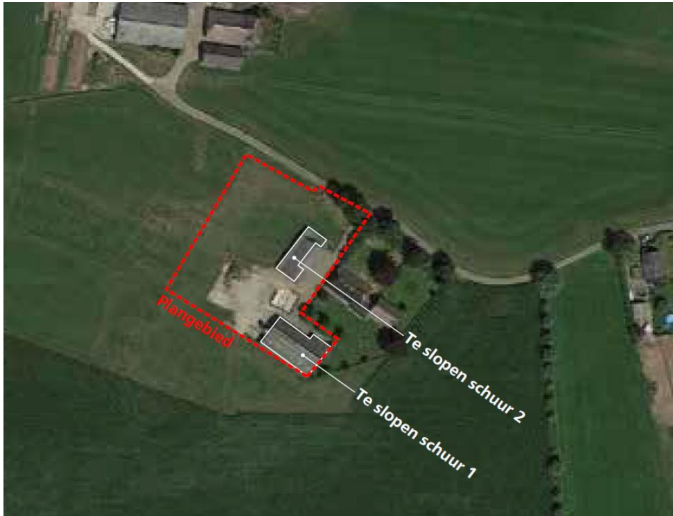
Figuur 1. Locatie te slopen schuren.

Het bestaande erf gelegen aan de Wellenberg 2 te Wijhe zal in tweeën worden gesplitst. De bestaande niet meer in gebruik zijnde schuren zullen worden gesloopt en op de vrijgekomen locatie zullen twee nieuwe woningen worden gerealiseerd. De beide schuren hebben beide een open constructie, enkelwandige muur deels beton en deels plaatwerk, dak van golfplaten zonder dakbeschot, geen betimmeringen met ruimten en spleten. De sloop wordt zo spoedig mogelijk na 1 september 2020 uitgevoerd, tenminste voor 1 februari 2021. De nieuwe woningen worden in 2021-2020 gebouwd.