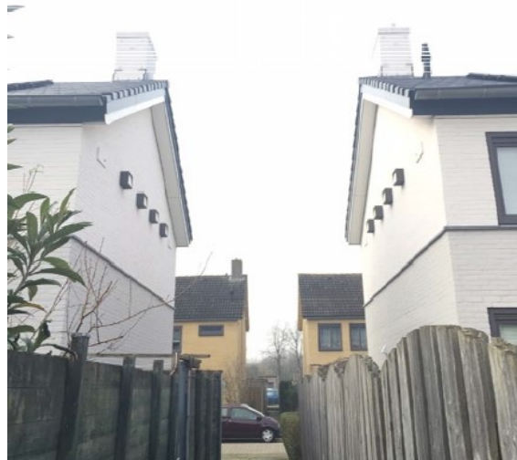
Figuur 2. Kaartje locaties en foto's huismuskasten Mozartstraat Zaltbommel