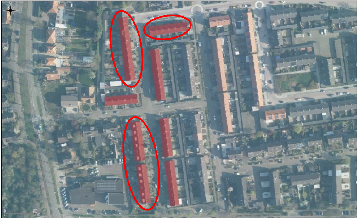
Figuur 1. Luchtfoto van de projectlocatie. In rood omlijnd de projectwoningen.