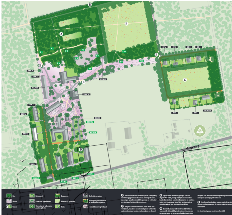
Figuur 3 Overzicht inrichting terrein Buitenplaats Koningsweg