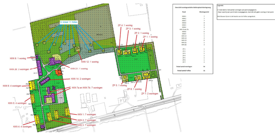
Figuur 4 Locaties woningen