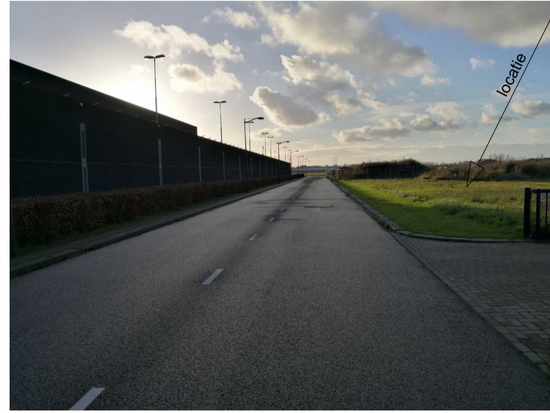
zuid-westelijke richting Malpensabaan