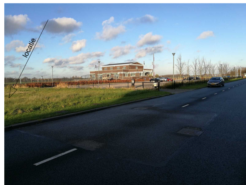
noord-oostelijke richting Malpensabaan