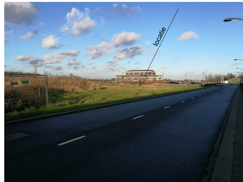
noord-oostelijke richting Malpensabaan