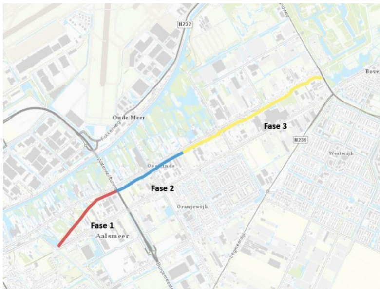
figuur: fasering project

Het traject is opgedeeld in drie fase. Deze staan hieronder afgebeeld. Het voorliggende projectplan heeft betrekking op fase I van het project. Dit deel begint ter hoogte van het kruispunt Aalsmeerderweg-Stommeerkade en eindigt bij de Waterwolftunnel.