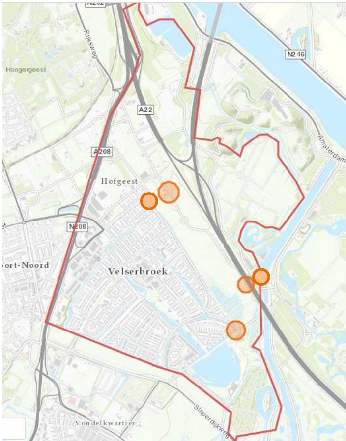
Figuur 1: Polder de Velsbroek (oranje indicatieve locaties maatregelen)

De ligging van de polder de Velsbroek is weergegeven in onderstaande figuur.