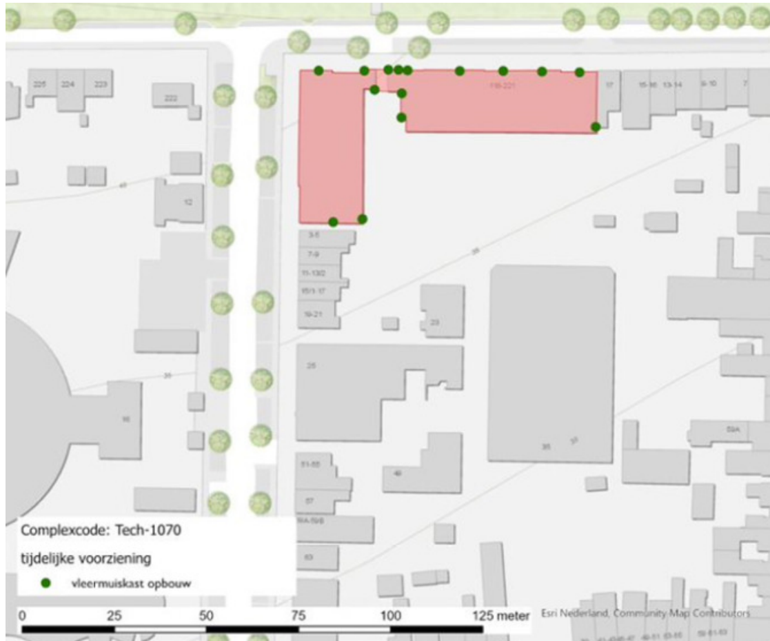
Figuur 3: Toegevoegde 15 vloermuiskasten