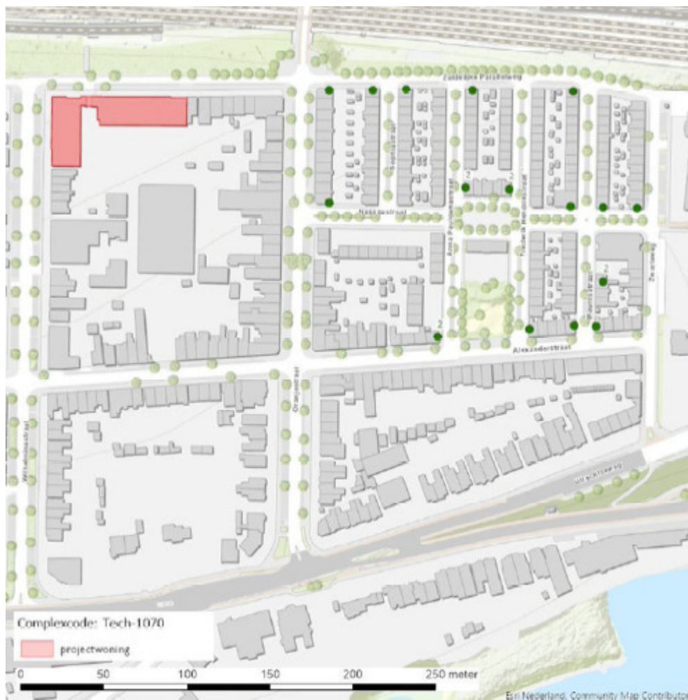
Figuur 2: Locatie van de eerste 20 tijdelijke alternatieven (bij stippen met een 2 hangen 2 vleermuiskasten)