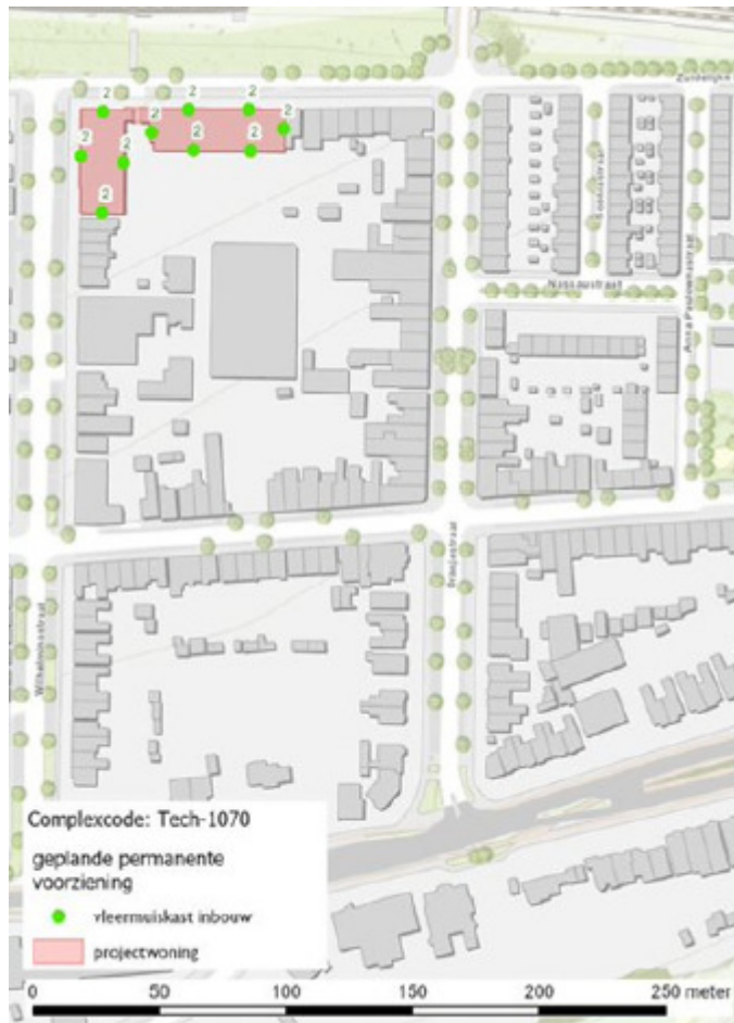
Figuur 4: Permanente voorzieningen