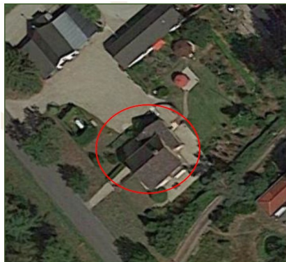
Fig. 2.5 Topografische aanduiding projectlocatie rood omcirkeld het te verwijderen pand (bronachtergrond: www.google.com)