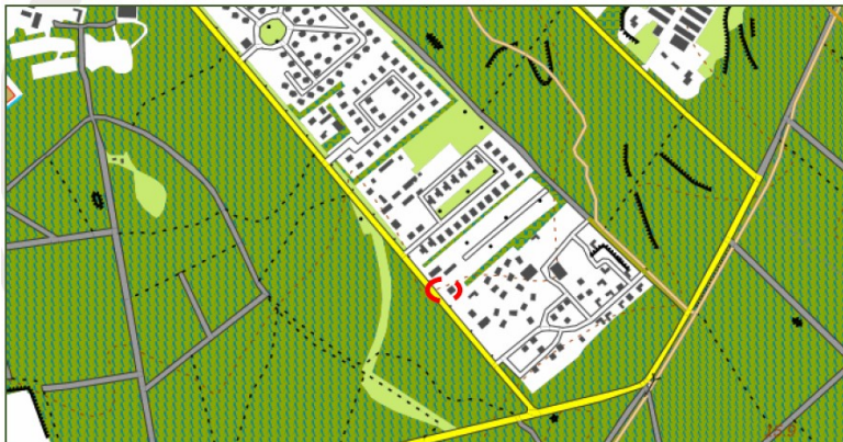
Fig. 2.7 Topografische aanduiding projectlocatie rood omcirkeld