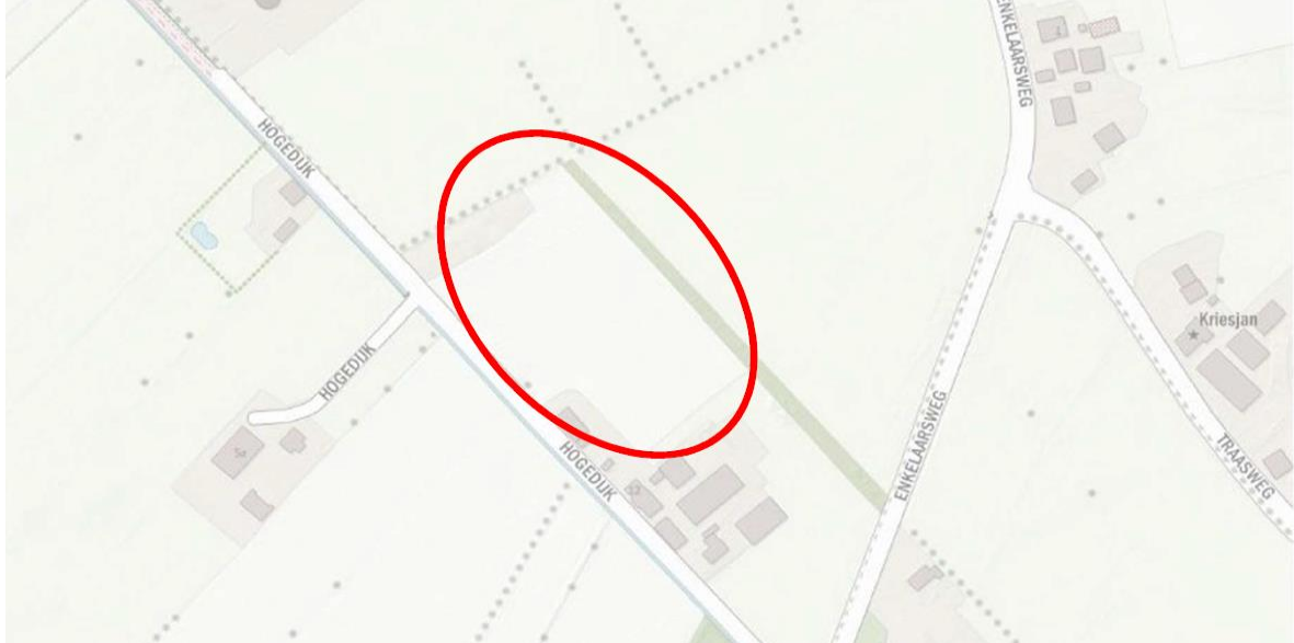
Figuur 1. Plangebied in het buitengebied van Markelo perceel P1243.

Aanvrager is voornemens om 1,33 hectare voedselbos aan te leggen op het perceel Markelo P 1243.