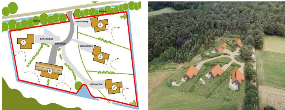
Figuur 2 – Inrichting na de werkzaamheden

De inrichtingswerkzaamheden worden uitgevoerd door een aannemer. De hoofdwerkzaamheden bestaan uit het noodzakelijke grondverzet en het vervolgens bouwen van de woningen en de aanleg van de verharding en beplantingen.