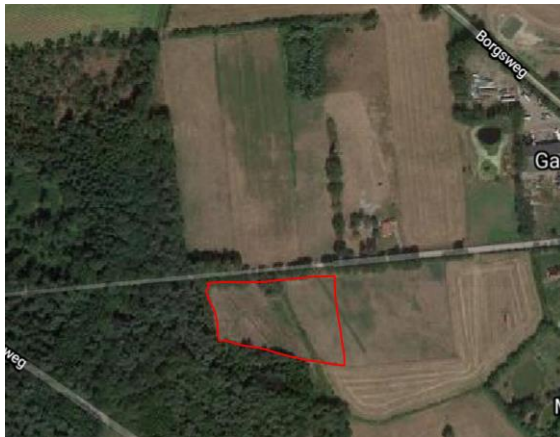
Figuur 1 – huidige projectgebied

Aanvrager wil 5 woningen bouwen in het buitengebied. Het projectgebied kenmerkt zich door een ruig grasland met daaromheen bos, een sloot en een houtwal. In het perceel is een ondiepe greppel aanwezig.