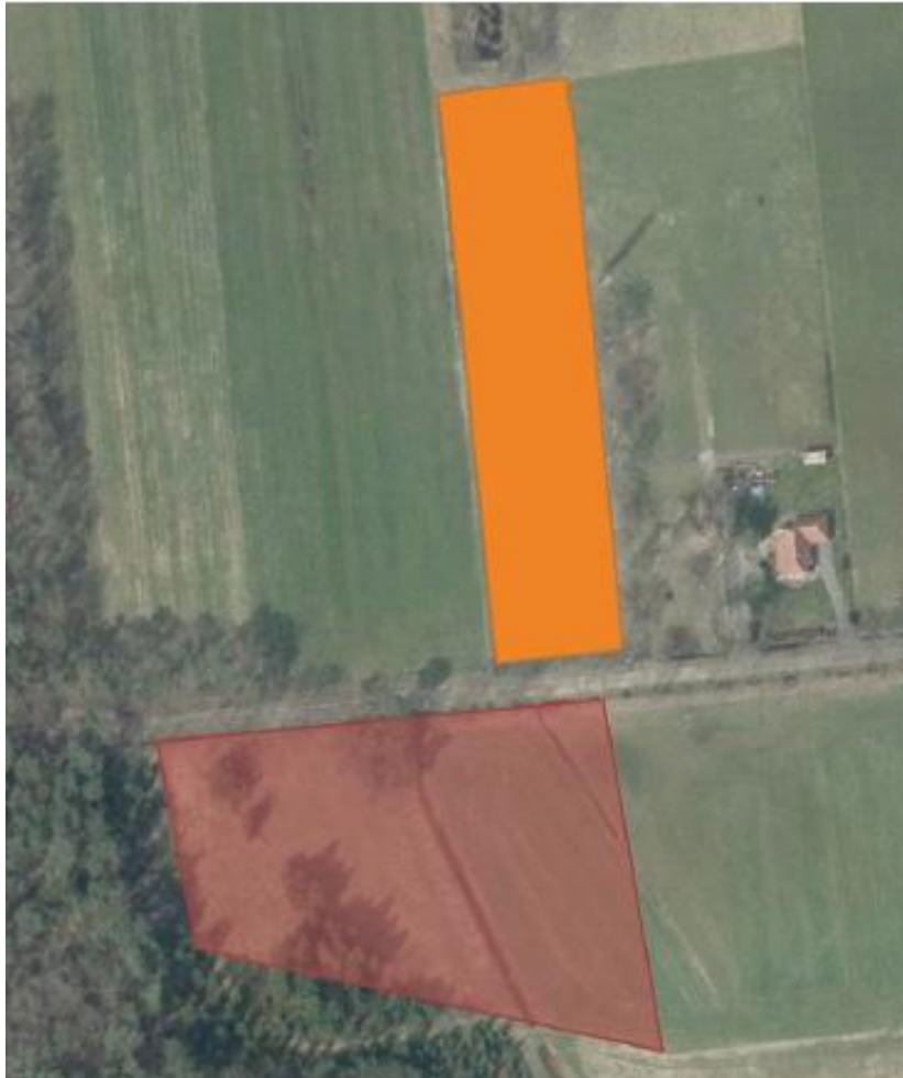
Figuur 3 – In het rood het huidige leefgebied van de levendbarende hagedis. In het oranje het nieuw in te richten leefgebied.