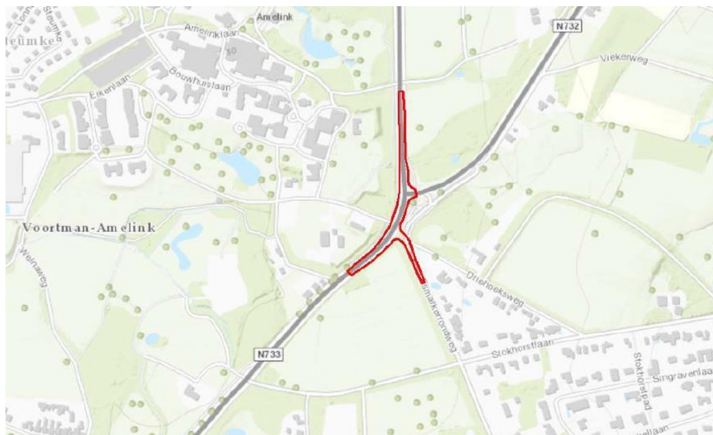
Figuur 1. Weergave van kruispunt van de provinciale weg N733 (Oldenzaalsestraat) met de N732 (Lossersestraat – Noord Esmarkerrondweg).

Het kruispunt verbindt verkeer naar Losser en Enschede Oost (via de Noord Esmarkerrondweg/Stokhorst en 'binnendoor' naar het Euregio bedrijventerrein). Deze laatste verbinding is een T-aansluiting van de Lossersestraat op de N733, waarna de Noord Esmarkerrondweg weer op de Lossersestraat aantakt. Met name deze laatste aansluiting van en naar de Noord Esmarkerrondweg geeft problemen in de verkeersafwikkeling en verkeersveiligheid.