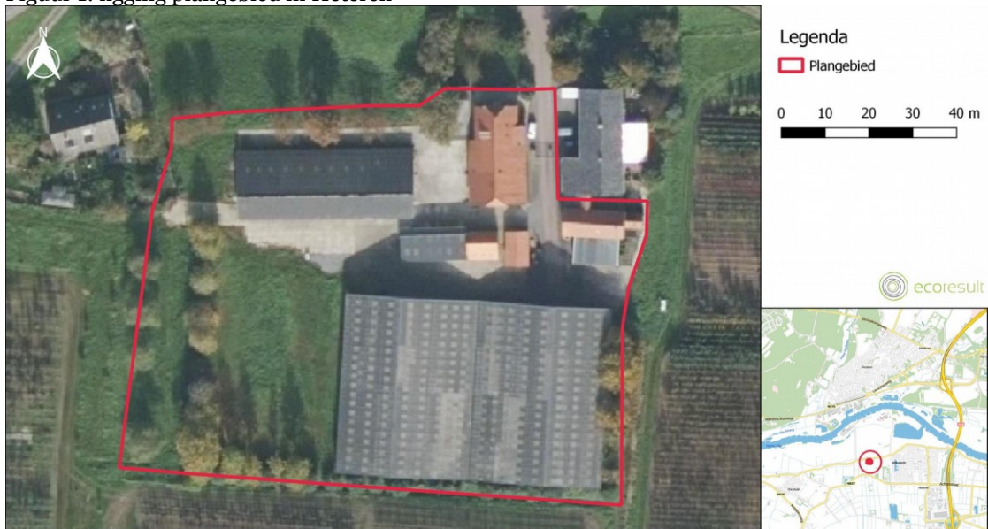
BIJLAGE 2: Plangebied Figuur 1: ligging plangebied in Heteren