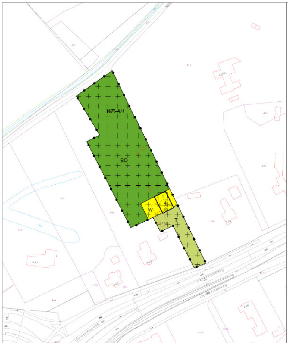
Figuur 1 locatie van woning (zwarte rechthoek binnen gele arcering)