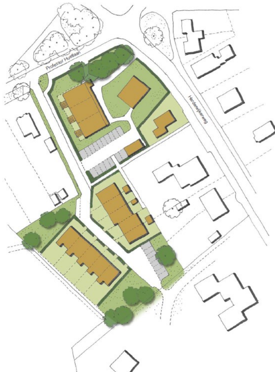
Figuur 2 locatie 19 woningen (zuidelijk 10 woningen in 2 rijen, noordwestelijk gebouw met 6 appartementen, noordoostelijk 2 woningen in bestaand gebouw en oostelijk 1 vrijstaande woning