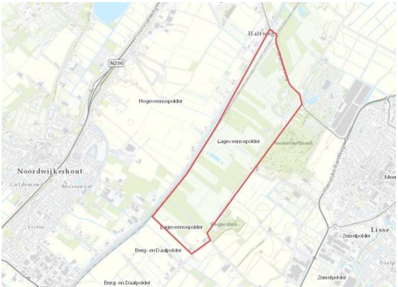
Figuur 2: Locatie Lageveensepolder

De ligging van de Lageveensepolder is weergegeven in onderstaande figuur. De polder bestaat voornamelijk uit gebieden met bollenteelt en natuur.