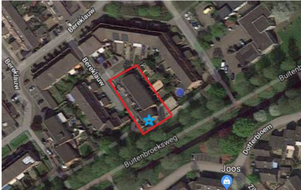
Figuur 1 – Locatie paarverblijfplaats van de gewone dwergvleermuis (blauwe ster)

In het onderzoek is 1 paarverblijfplaats van de gewone dwergvleermuis waargenomen. Deze bevindt zich in de spouw van de kopgevel van de hoekwoning op nummer 93. Andere verblijfplaatsen en functies zijn niet vastgesteld.