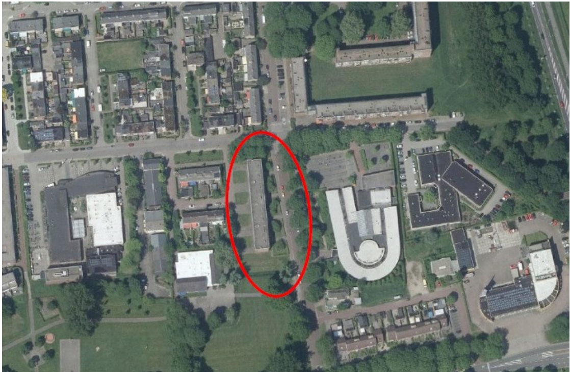
Figuur 1: Plangebied Berkenlaan 58-104, Zutphen