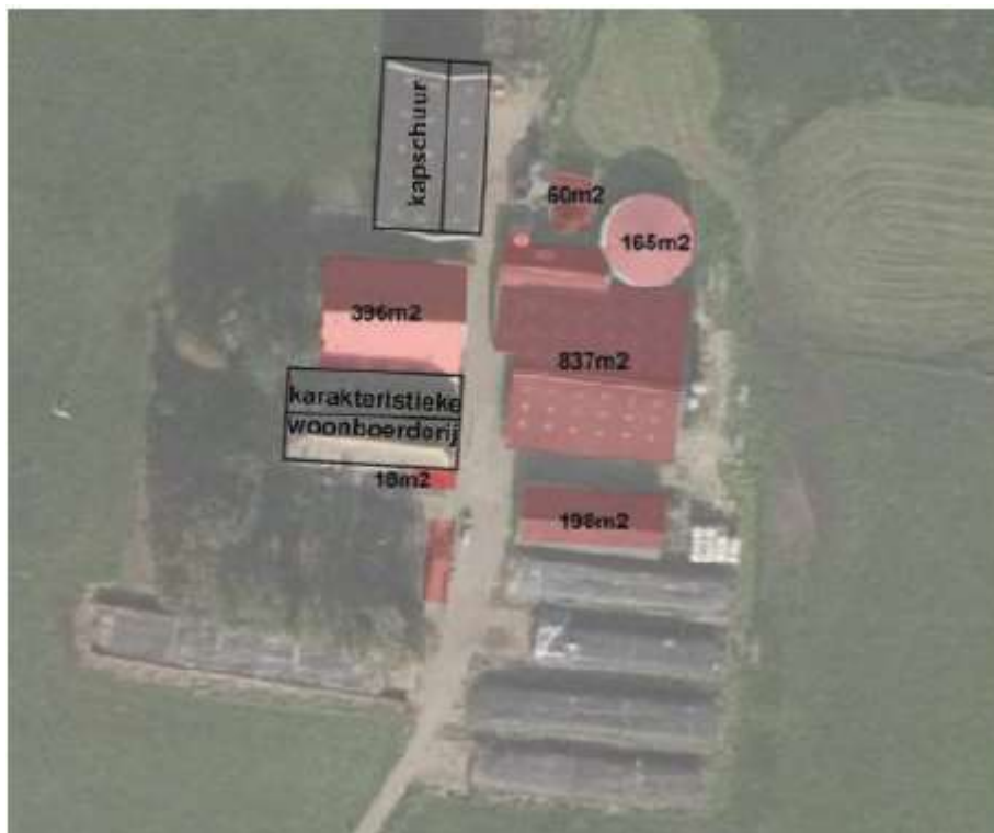
Plangebied met in rood de te verwijderen gebouwen

De initiatiefnemer is voornemens het erf aan de Bremmelstraat 13 te Wijhe her in te richten. Er worden twee koeienschuren, drie opslagruimtes en een meststalo gesloopt. Tevens wordt een nieuwe woning gerealiseerd. Op de onderstaande afbeelding zijn de te verwijderen gebouwen met rood aangegeven. De huidige bedrijfsvoering (veehouderij) wordt gestaakt op het erf.