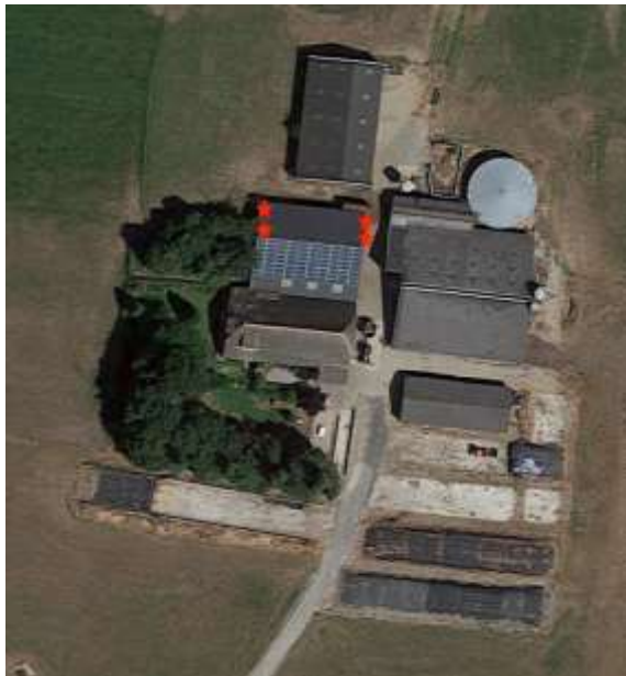
Afbeelding: Rood nestlocaties huismussen

Op 4 april en 16 april 2019 zijn veldonderzoeken op en om de planlocatie uitgevoerd. Beide keren werden op de planlocatie 8 tot tien huismussen foeragerend aangetroffen. Ook werden vier nesten aangetroffen.